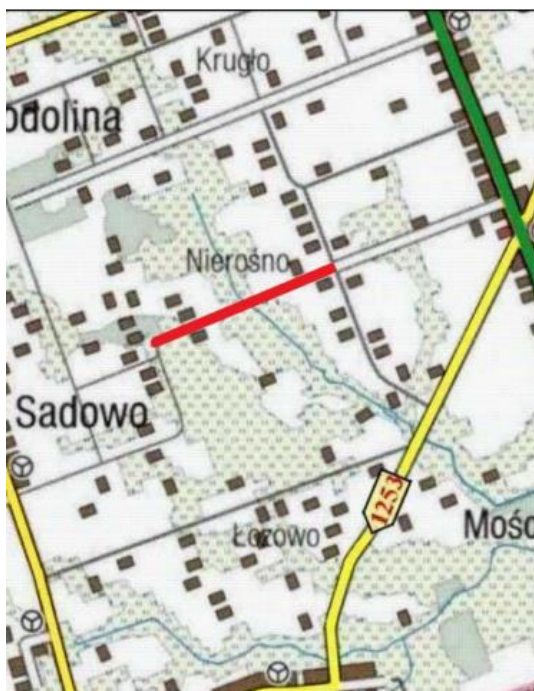
Rys. 3. Odcinek IV (droga gminna na odc. Nierosno – kol. Nierosno)

z siedzibą w Sokółce, ul. Torowa 12, 16-100 Sokółka, wpisana do rejestru przedsiębiorców Krajowego Rejestru Sądowego pod numerem KRS 0001023026 prowadzonego przez Sąd Rejonowy w Białymstoku, XII Wydział Gospodarczy Krajowego Rejestru Sądowego, NIP 5451826561, REGON 524647629, kapitał zakładowy 5 000,00 zł, tel. 85 711 89 09, 85 711 89 10