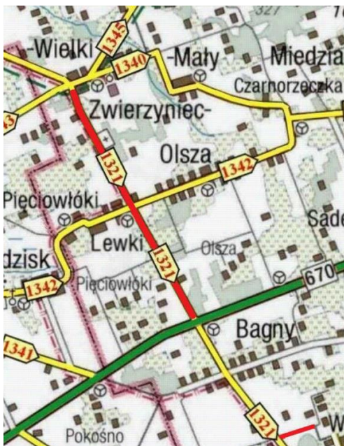
Rys. 1. Lokalizacja odcinka I oraz odcinka II (ciąg drogi powiatowej nr 1321B, zjazd na działkę gminną nr 81, Wroczyńszczyzna)