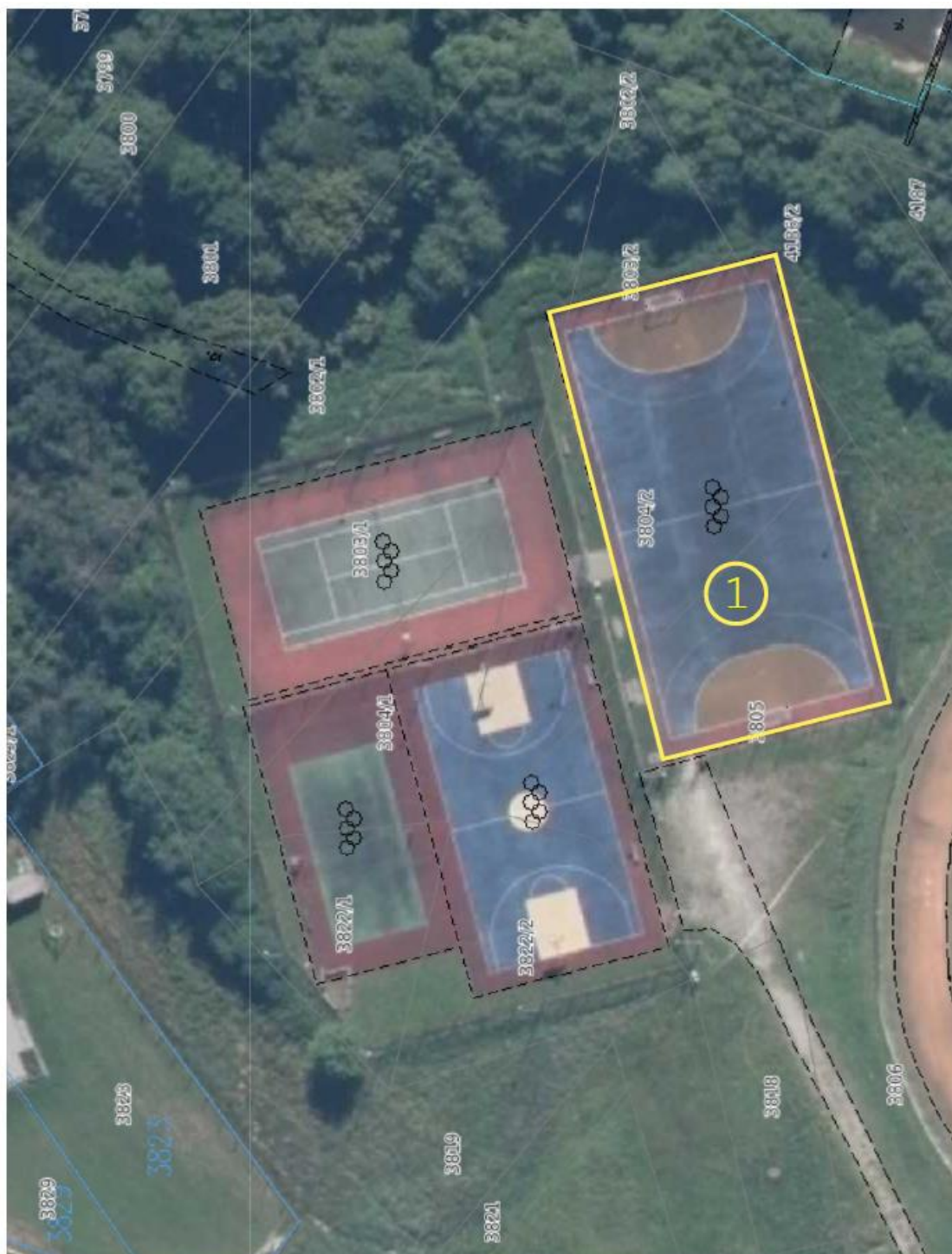
Rys. 1 Zagospodarowanie terenu – usytuowanie boiska

1 – boisko do piłki ręcznej – do przebudowy (zmiana nawierzchni)