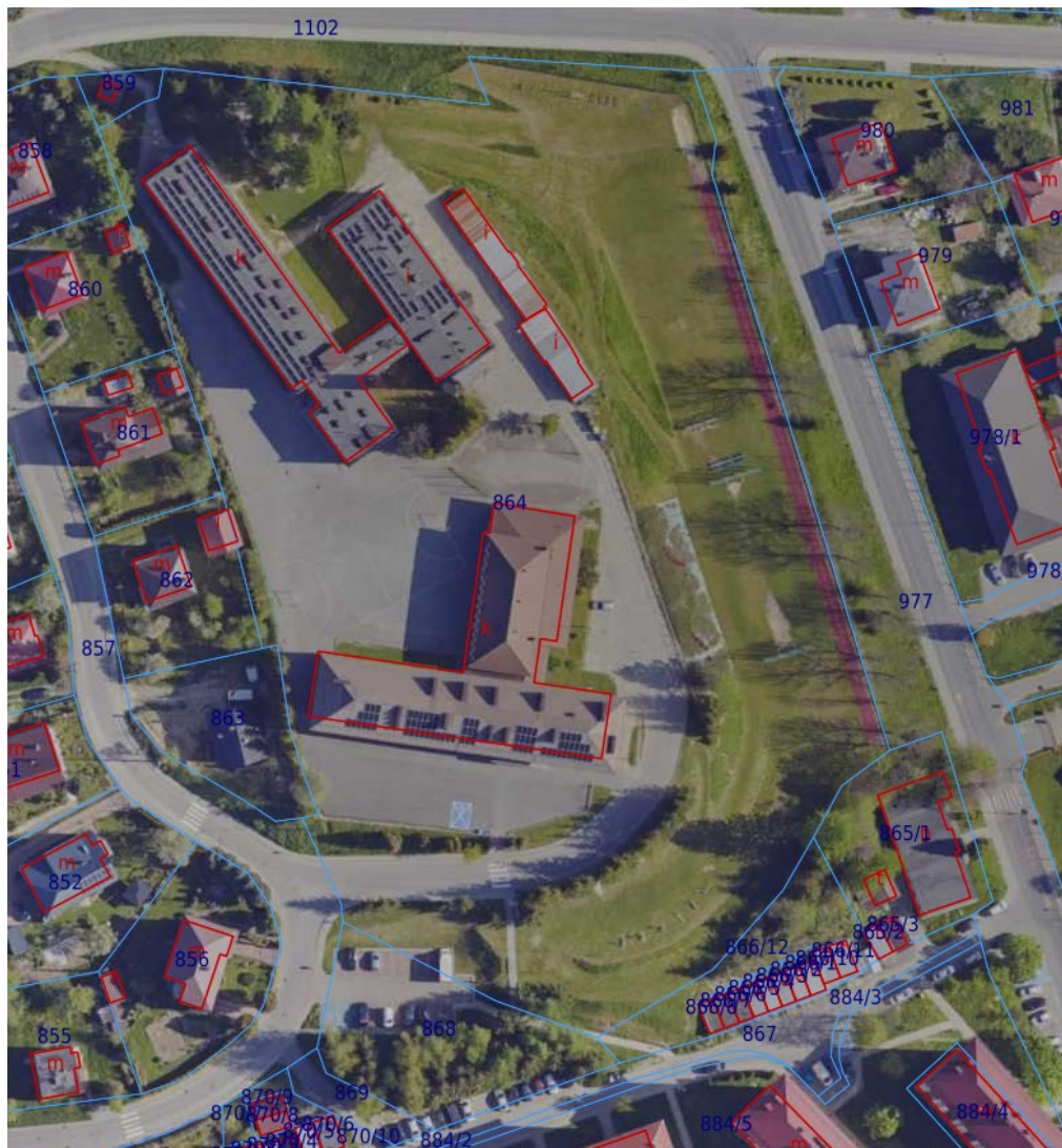
Teren inwestycji

Przedmiotem zamówienia są roboty budowlane przebudowy, rozbudowy i nadbudowy budynku sali gimnastycznej przy Szkole Podstawowej nr 2 w Ustrzykach Dolnych wraz z budową łącznika i przebudową niezbędnych pomieszczeń szkoły.