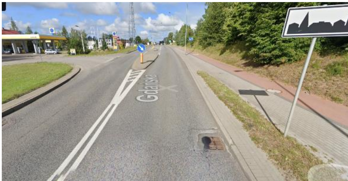
Rysunek 3. Widok drogi DW221

Jednocześnie planowana jest rozbudowa drogi na odcinku na dojazdach do granicy Nowej Karczmy z kierunku Kościerzyny oraz Przywidza. Inwestycje te przewidują podniesienie nośności nawierzchni do 115kN/oś oraz konstrukcję dla ruchu KR4.