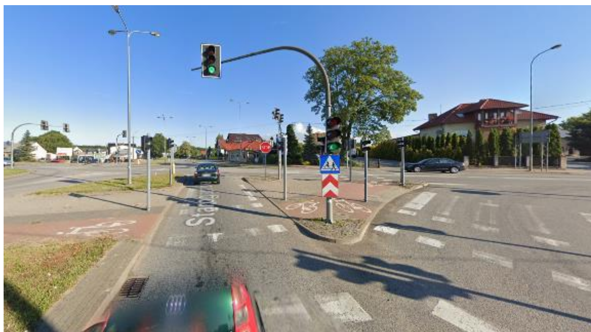
Rysunek 5. Widok skrzyżowania z DW224