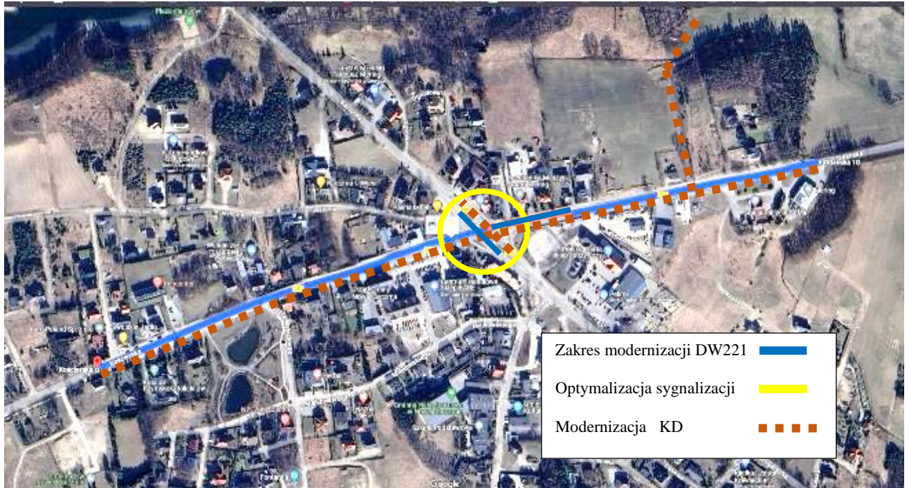
Rysunek 2. Miejsce inwestycji