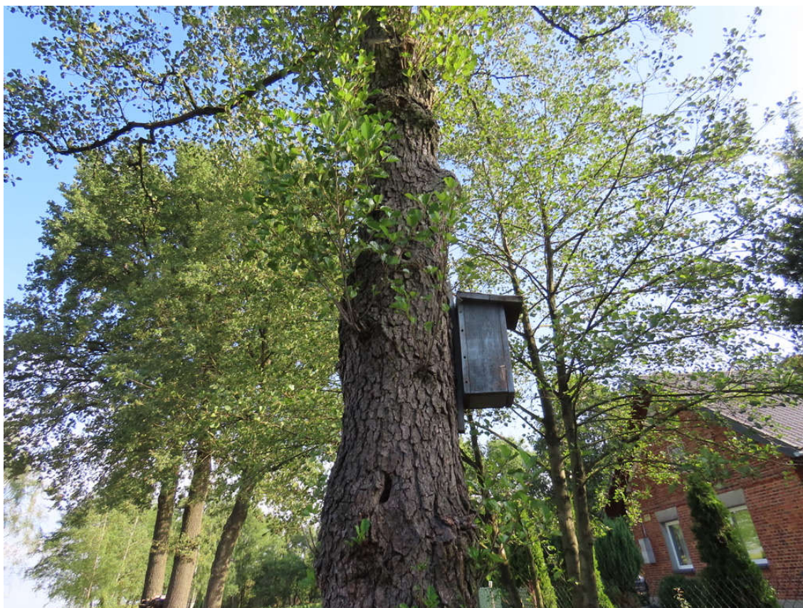
Fot. 2. Olcha czarna nr 1, na drzewie budka lęgowa.