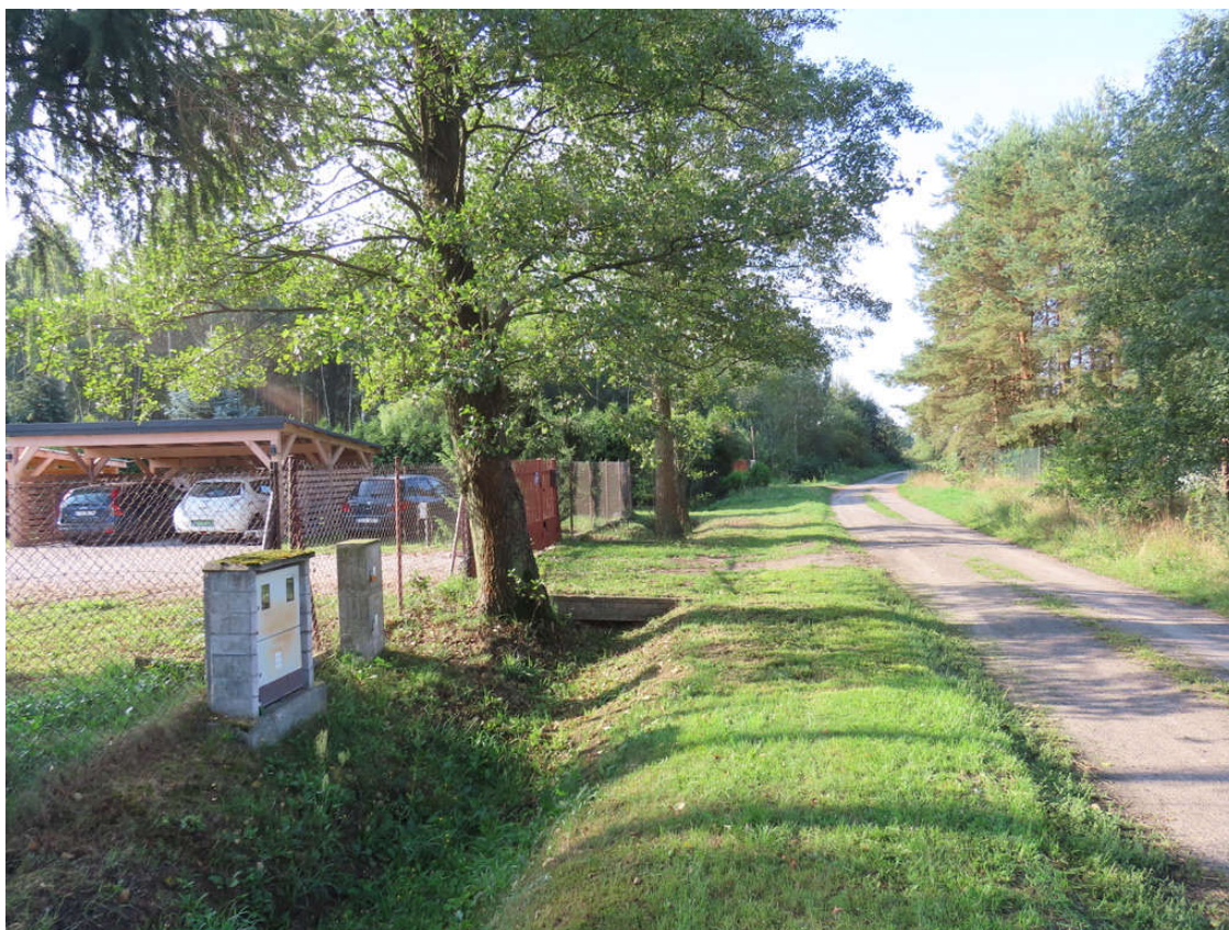
Fot. 1. Olchy czarne przeznaczone do wycinki o nr 2-4.