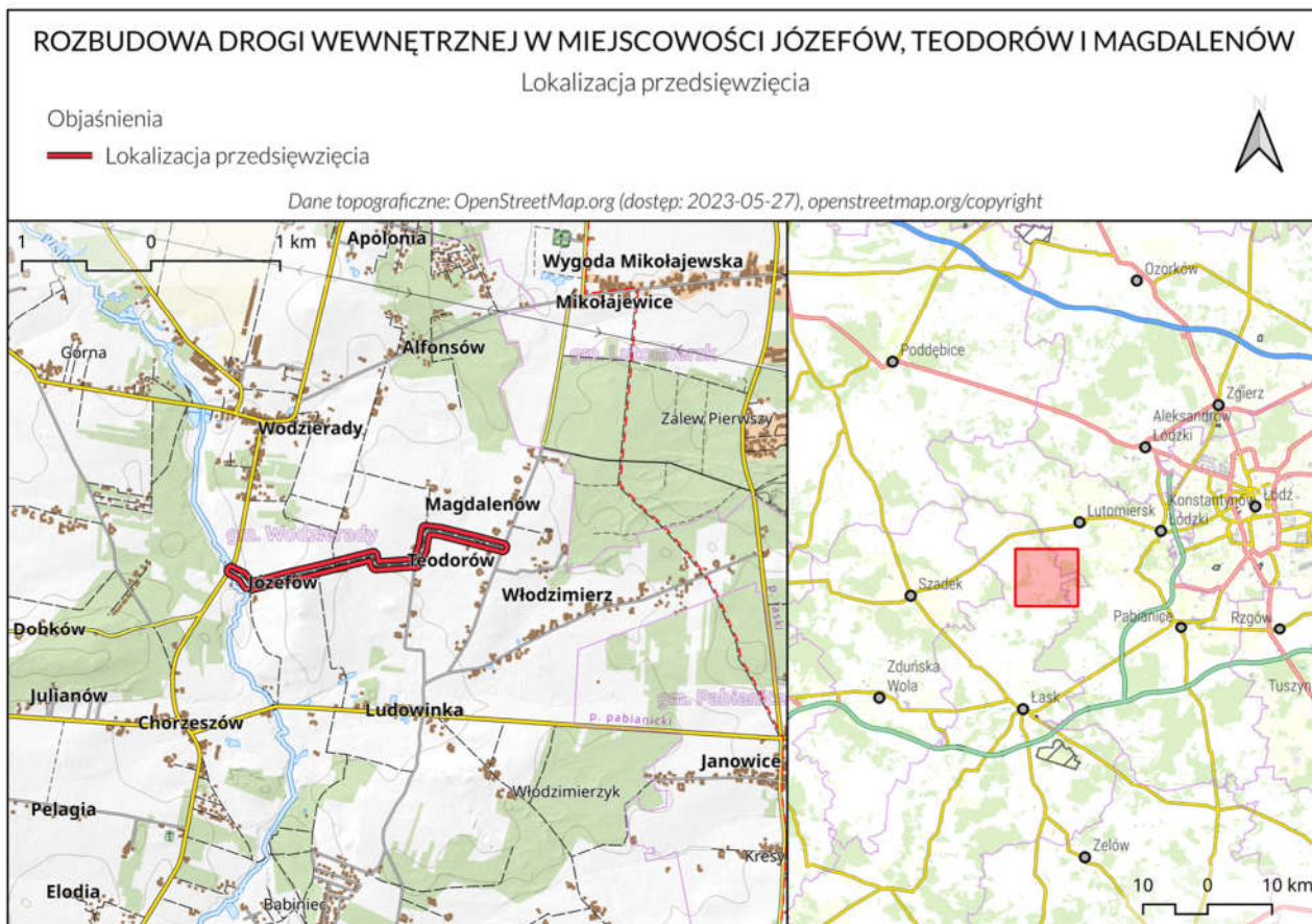
Ryc. 1. Lokalizacja inwestycji: Rozbudowa drogi wewnętrznej w miejscowości: Józefów, Teodorów i Magdalenów.

Przedmiotem opracowania jest inwentaryzacja drzew rosnących przy drodze wewnętrznej w miejscowości: Józefów, Teodorów i Magdalenów, w gminie Wodzierady. Inwentaryzację wykonano na potrzeby przeprowadzenia wycinki drzew w związku z planowaną rozbudową drogi.