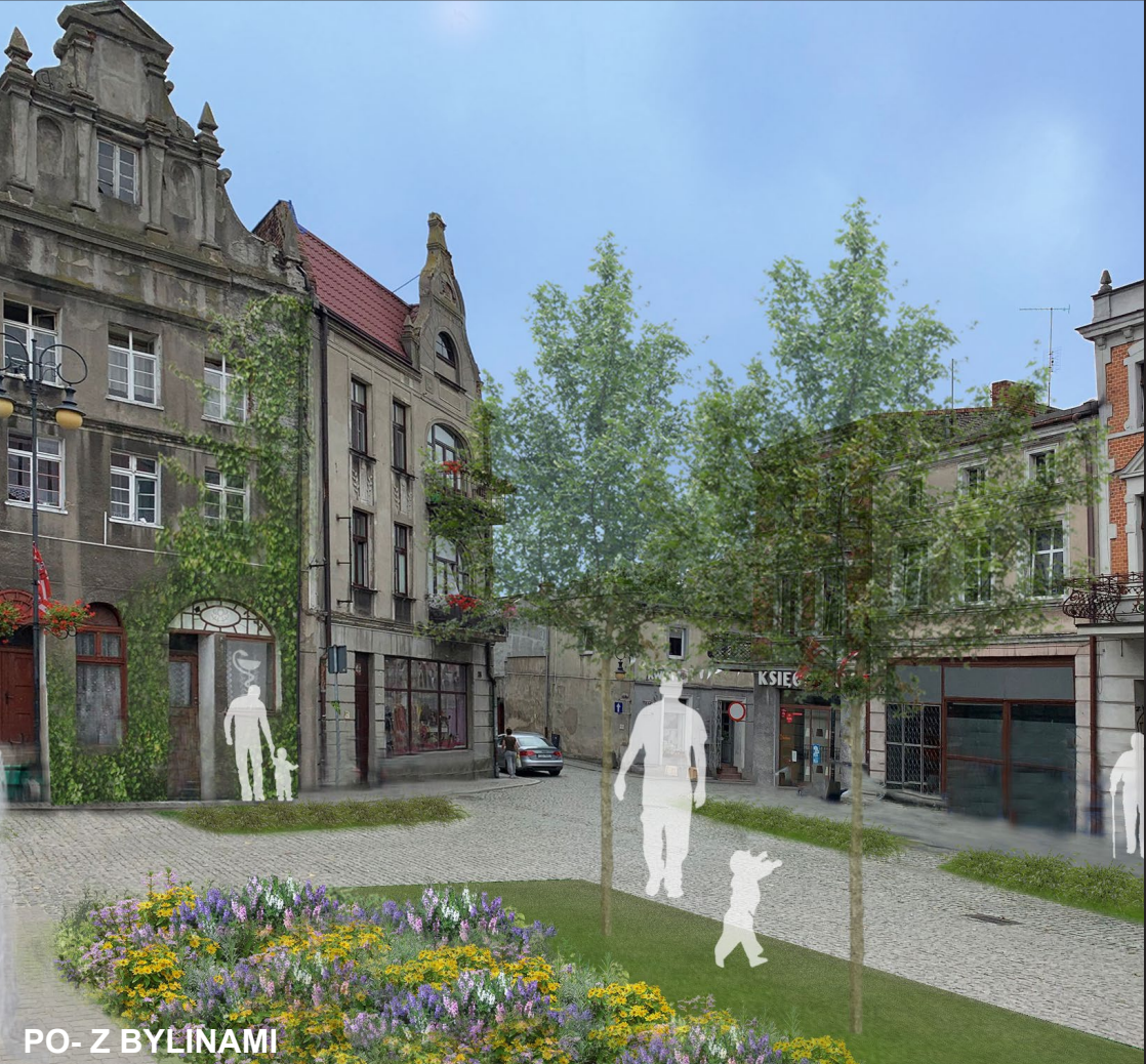
PO- Z BYLIŃAMI