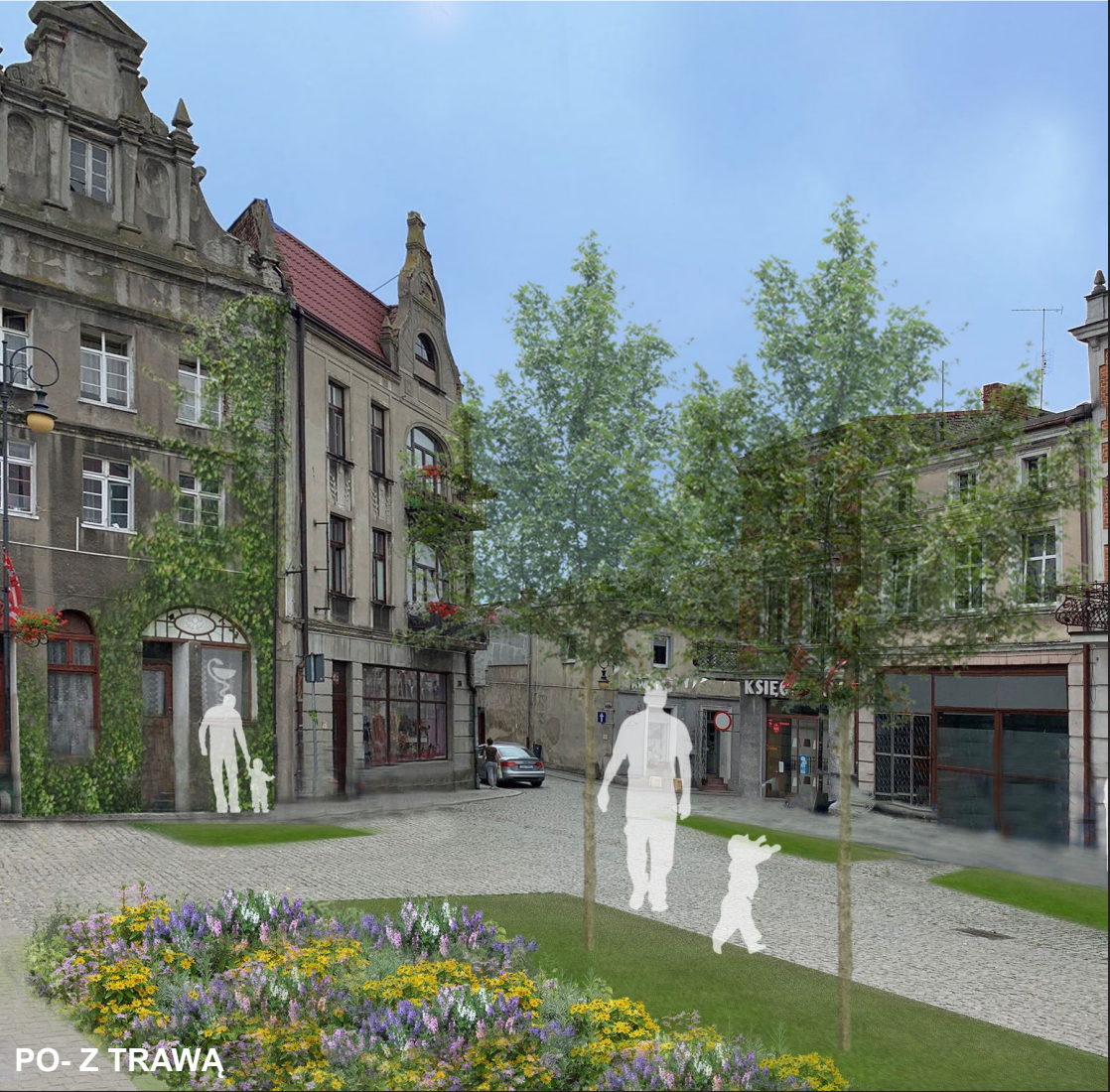
PO- Z TRAWĄ