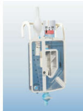
XL200S - pediatryczny z kontrolą ssania