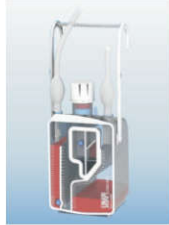
XL2000SD dwustronnie ssący i kontrola ssania