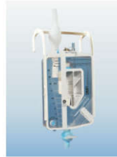
XL200 - pediatryczny