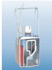
XL2000S Z kontrolą ssania