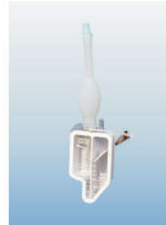
XS50 - ambulatoryjny