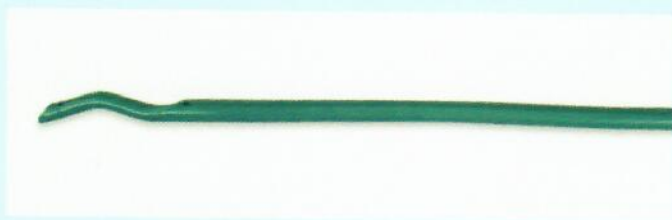
Cewniki BioFlo Duramax wykonane Technologią Endexo

W cewniku powstaje minimalna ilość skrzepów, włókna lub skrzepilin.