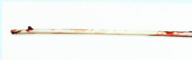
Cewnik permanentny do dializ Palindrome H.

83% spadek tworzenia się skrzepów w porównaniu do cewnika permanentnego do dializ Palindrome H, próba in vitro (w oparciu o liczbę płytek krwi).