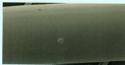
Obrazy SEM (mikroskopia scanningowa)

Cewniki BioFlo Duramax, wykonane Technologią Endexo, powiększenie 10x.