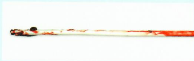
Cewnik permanentny do dializ Palindrom.

84% spadek tworzenia się skrzepów w porównaniu do niepowlekanego cewnika permanentnego do dializ Palindrom, próba in vitro (w oparciu o liczbę płytek krwi).