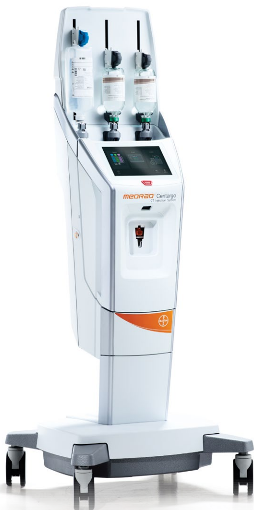
Wstrzykiwacz na statywie jezdnym

Medrad® Centargo – tłokowy bezwkładowy trzykanałowy wstrzykiwacz środka kontrastowego do badań metodą tomografii komputerowej.