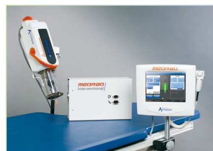
3) Opcja mocowania do stołu