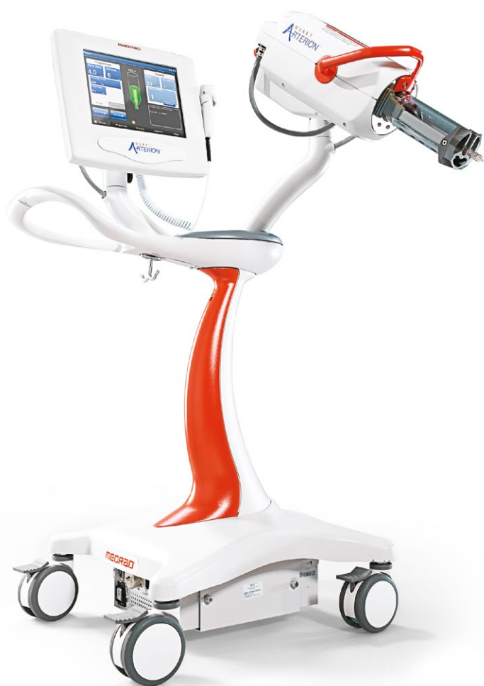
Wstrzykiwacz na statywie jezdnym

Medrad® Mark 7 Arterion – angiograficzny wstrzykiwacz automatyczny do podawania środków kontrastowych.