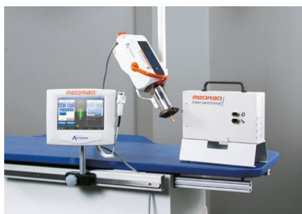
2) Opcja zawieszenia sufitowego