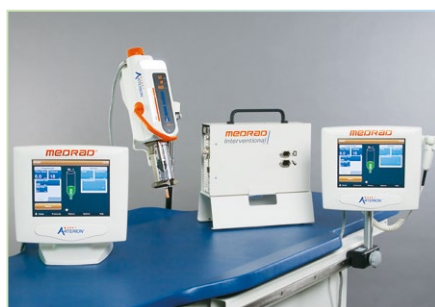
1) Opcja 2 monitorów z mocowaniem do stołu