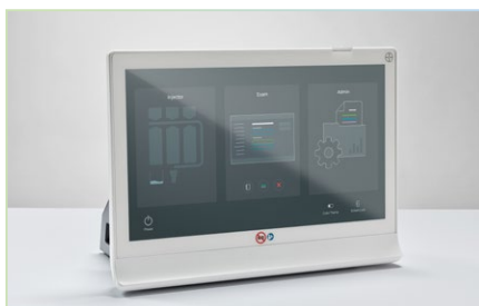
Dotykowy ekran sterujący