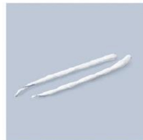
TUPFER LR LARYNGOLOGICZNY