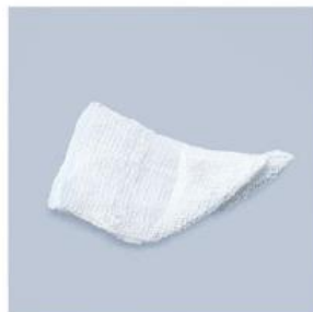
TUPFER H PAPRYKA