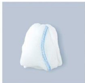
TUPFER ER KAPTUR