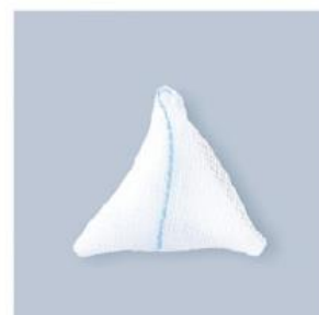
TUPFER DR ROŻEK