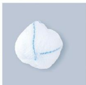
TUPFER AR KULA