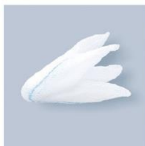
TUPFER CR SĄCZEK