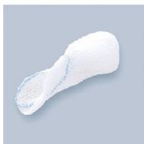
TUPFER BR FASOLKA