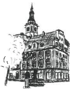
Rynek Wleża ratuszowa