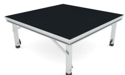
PODEST 100x100cm nośność 750kg/m 2