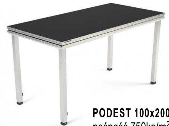
PODEST 100x200cm nośność 750kg/m 2