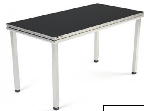
PODEST 50x100cm PODEST 50x200cm nośność 750kg/m 2