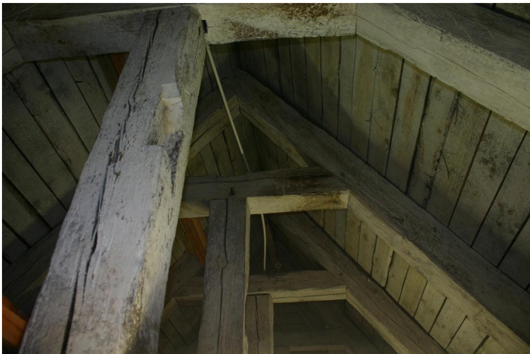
Fot.2. Widok ogólny na zabytkową wieżbę od strony strychu nad Ośrodkiem Kultury w Trzebiatowie, datowanej na 2 poł. XVII w. Obecnie powierzchnia drewna biała od warstwy wapna.