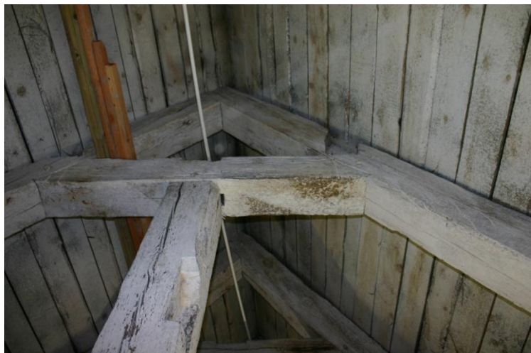
Fot.3. Więźba z drewna iglastego, prawdopodobnie sosnowego z 2 poł. XVII w. w strefie nad obecnym Ośrodkiem Kultury w Trzebiatowie, stan w grudniu 2021r.

Dn. 17.12.2012 r. dokonano oględzin więźby dachowej w udostępnionym przez Dyрекcję Trzebiatowskiego Ośrodka Kultury magazynie muzealiów.