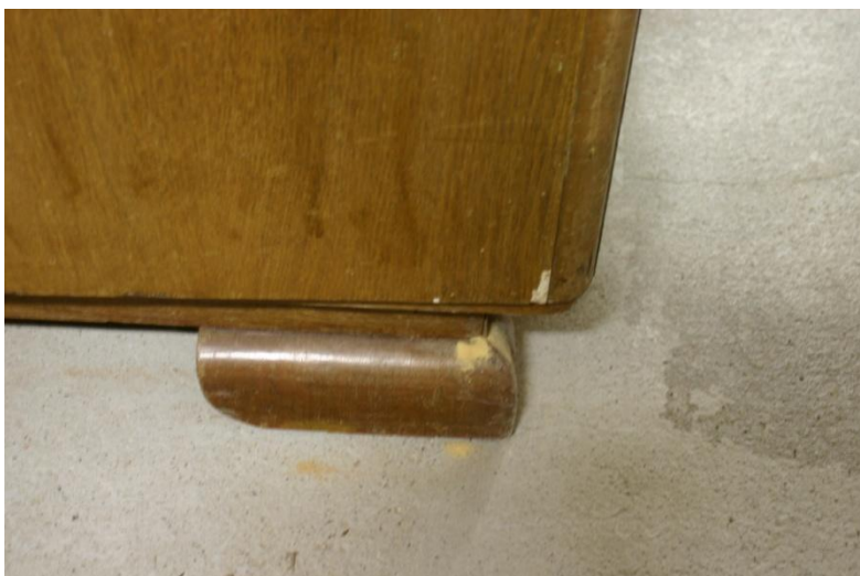
Fot.6. Ślady świadczące o aktywnym żerowaniu drewno jadów również w drewnianych meblach przechowywanych na strychu pod zabytkową więźbą. Kopczyki miału drzewnego.