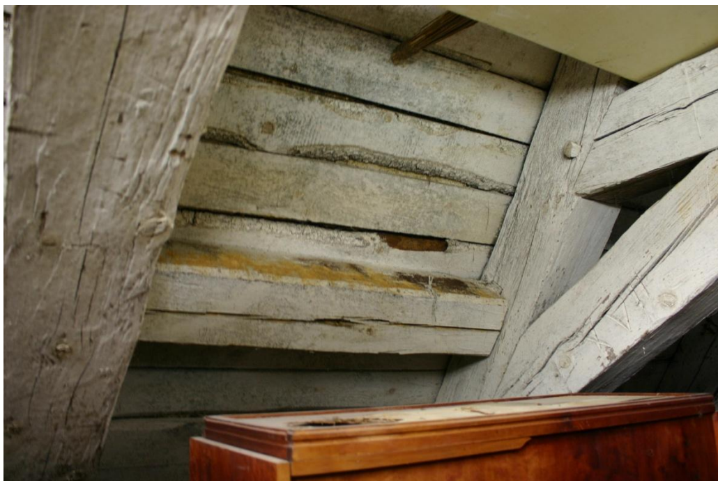
Fot.5. Łączenie wykonane z desek z zewnętrznych części pnia, często nie do końca okorowanych. Kopczyki mialu drzewnego na belce poniżej świadczą o aktywnym żerowaniu drewno jadów.

Ogólny stan zachowania jest dość dobry, wymaga jednak pilnej interwencji w związku z żerowaniem owadów, szkodników drewna. Zaobserwowano liczne, świeże kopczyki mialu drzewnego. Znajdowały się zarówno na powierzchniach elementów konstrukcyjnych wieźby, jak i na górnych częściach kilku muzealiów (meble, gospodarcza waga szalkowa) znajdujących się pod nimi. Lokalizacja kopczyków wskazuje, że zaatakowane jest także łączenie połaci dachowych.