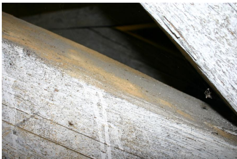
Fot.4. Fragment drewnianej więźby sosnowej datowanej na 2 poł. XVII w. Na powierzchni belek widoczne stare otwory po drewno jadach, ale również kopczyki drewnianego mialu świadczące o obecności aktywnych drewno jadów.

Więźba wykonana z drewna iglastego, prawdopodobnie sosnowego, w przeszłości naprawiana metodami ciesielskim. Obecnie powierzchnia drewna w kolorze białym. Z dokumentów wynika, że w latach 80-tych XX w. wykonano dezynsekcję powierzchni więźby od strony wnętrza strychu mieszaniną środka dezynsekcyjnego i wapna, stąd obecny kolor powierzchni drewna.