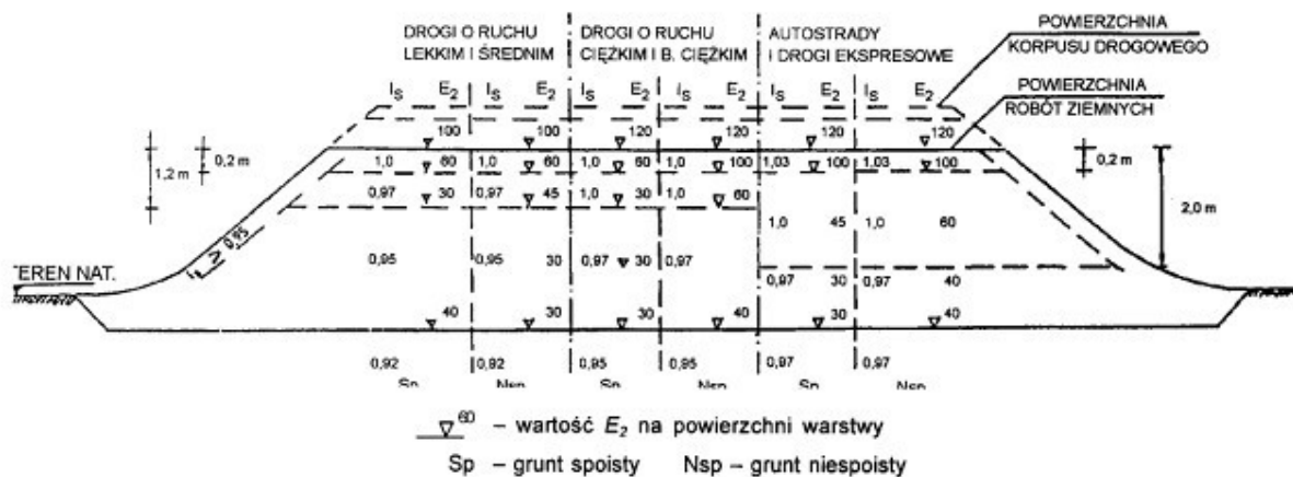
Rys. 1. Wartości wymagane w nasypach: wskaźnika zagęszczenia I_s i wtórnego modułu odkształcenia E_2 , w [MPa], wg [1].

Jako zastępcze kryterium oceny wymaganego zagęszczenia gruntów dla których trudne jest określenie wskaźnika zagęszczenia I_s , przyjmuje się wartość wskaźnika odkształcenia I_0 , wyznaczanego jak określono w punkcie 1.4.3. Wskaźnik odkształcenia I_0 nie powinien być większy niż: