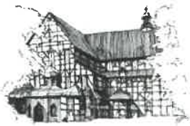
Kościół Pokoju pw. Św. Trójcy Wpisany na liście UNESCO