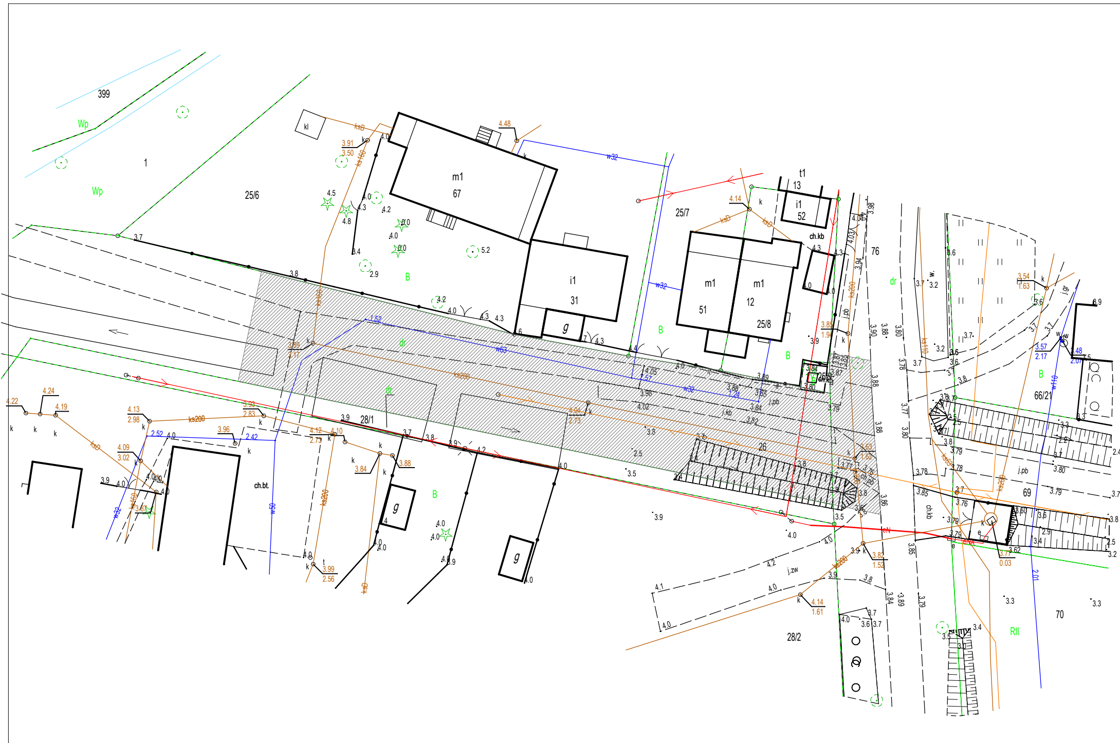
PRZEBUDOWA DROGI GMINNEJ 191068G W TROPISZEWIE W GMINIE LICHNOWY - PRZEWIDYWANY ZAKRES OPRACOWANIA