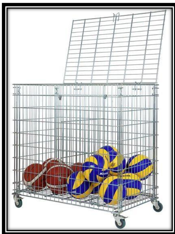
Rys. 2. Zdjęcie przedstawia przykładowy wózek koszykowy na piłki