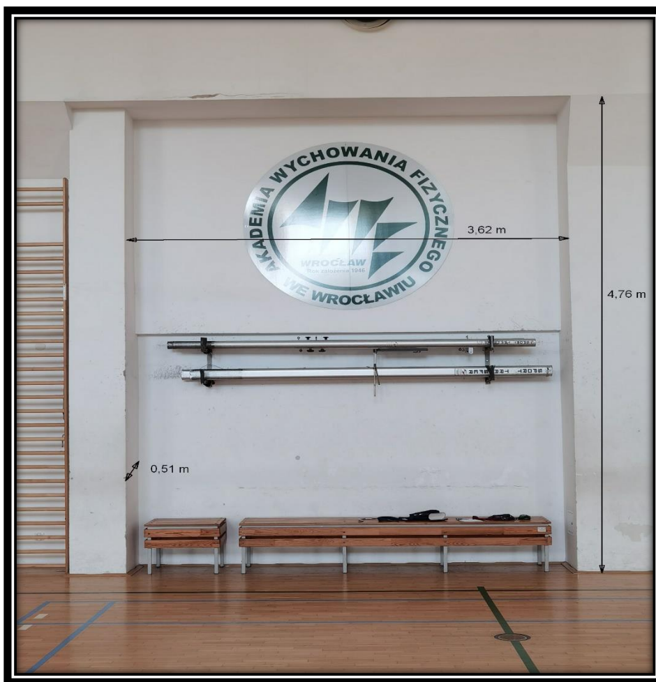
Rys. 4. Zdjęcie przedstawia ścianę z wymiarami na której ma być zainstalowana tablica