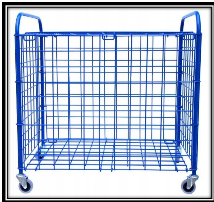
Rys. 1. Zdjęcie przedstawia przykładowy wózek koszykowy na piłki