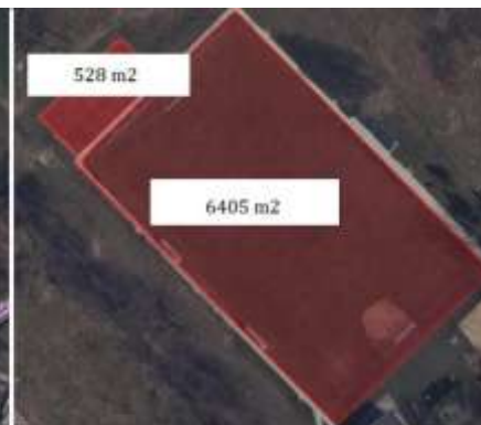
Boisko "Kominiarska" ul. Kominiarska 68, powierzchnia działki 19 298 m 2 , powierzchnia boiska trawiastego 6405 m 2 , powierzchnia boiska EPDM 528 m 2