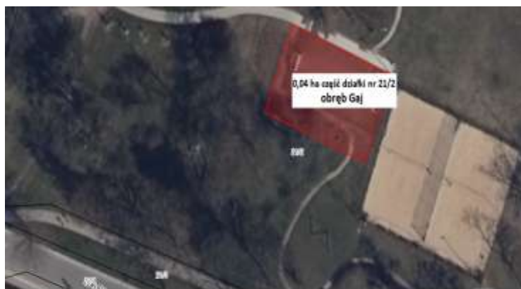
Boisko do piłki nożnej w Parku Skowronim, przy ulicy Weigla