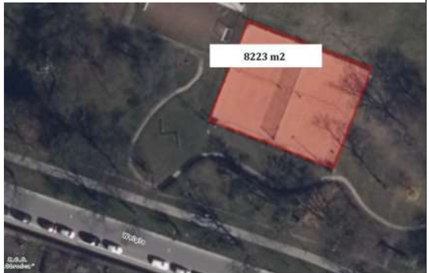
Ul. Weigla, 50-981 Wrocław powierzchnia całkowita: około 8223 m 2 , powierzchnia boiska sportowego o nawierzchni naturalnego piasku

Adres obiektu: ul. Weigla, 50-981 Wrocław Powierzchnia całkowita: około 8223 m 2 , powierzchnia boiska sportowego o nawierzchni naturalnego piasku