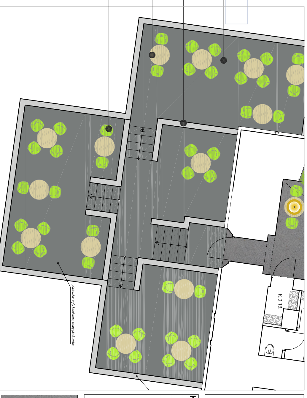
UKŁAD TARASOWY KAWIARNI ZEWNIĘTRZNEJ 1:100

3' krzesło z tworzywa ABS, ażurowe oparcie, nogi aluminium, kolor zielony