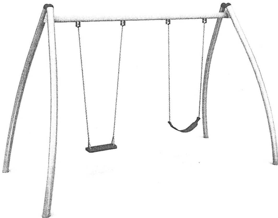
Rysunek nr 1- Huśtawka podwójna