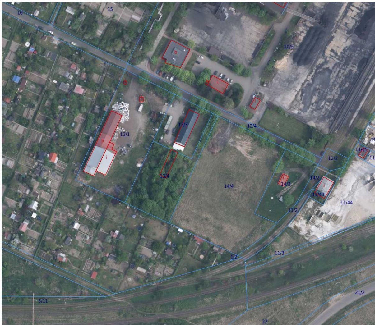
Rysunek 1. Planowany teren inwestycji – dz. nr 14/4.

Planowana Kotłownia na biomasę zostanie zlokalizowana na działce nr ewid. 14/4, obręb AM37 w Oleśnicy przy ul. Ciepłej. Tytuł prawny do działki posiada Gmina Oleśnica. Wieczystym użytkownikiem tego terenu jest MIEJSKA GOSPODARKA KOMUNALNA SPÓŁKA Z O.O. W OLEŚNICY.