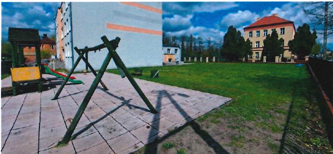
Fotografia 2 Widok terenu inwestycji

Na terenie objętym inwestycją zaprezentowano na fotografii poniżej. (fot. 2)