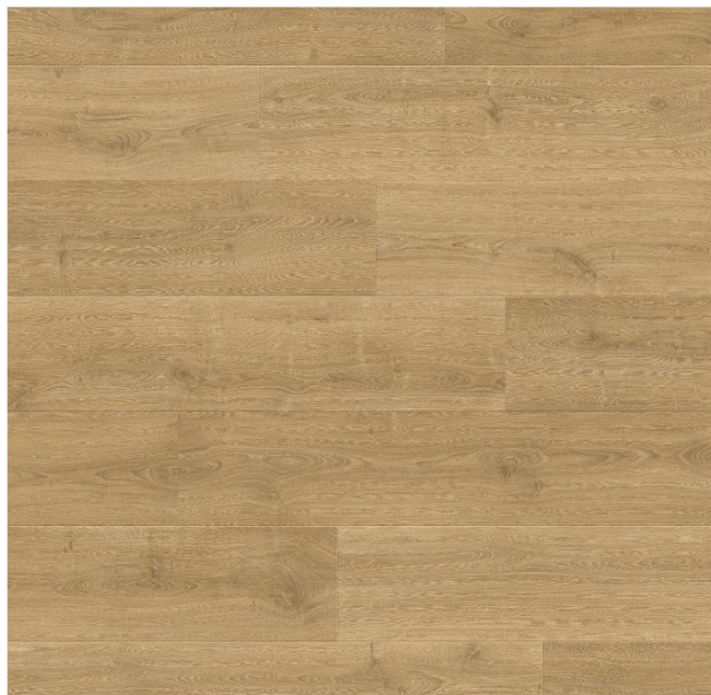
Kolor podłogi- kolor żaluzji