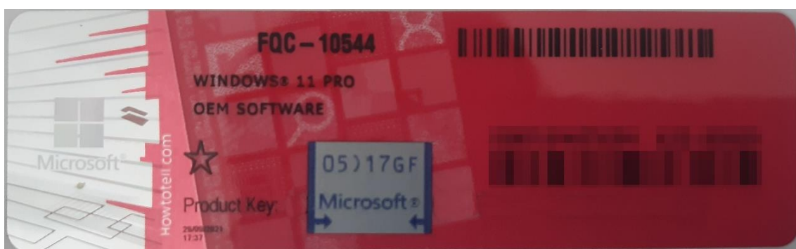
Rys. 1 przykładowy kod zabezpieczony przez producenta systemu Microsoft Windows 11 (takie same naklejki mają Windows 10) z wymazaniem, znajdującym się przed i za szarą naklejką kodem licencyjnym

Poniższe zdjęcie obrazuje obecnie stosowane zabezpieczenia producenta firmy Microsoft (klucz systemu jest zabezpieczony naklejką hologramową przez producenta. Po jej zdrapaniu uzyskujemy dostęp do oryginalnego klucza):