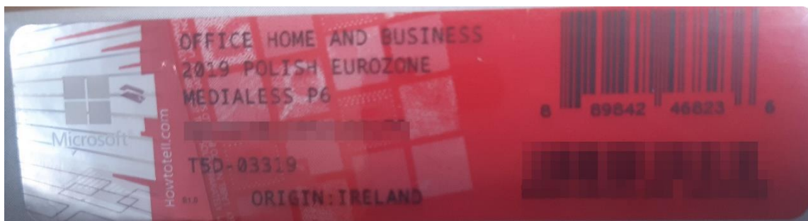
Rys. 2 przykładowy kod zabezpieczony przez producenta systemu Microsoft Windows Office Home&Business z wymazaniem, znajdującym się w prawym dolnym rogu numerem seryjnym produktu. Kod licencyjny znajduje się w środku szczelnie zapakowanego i zafoliowanego pudełka (Rys. 3)