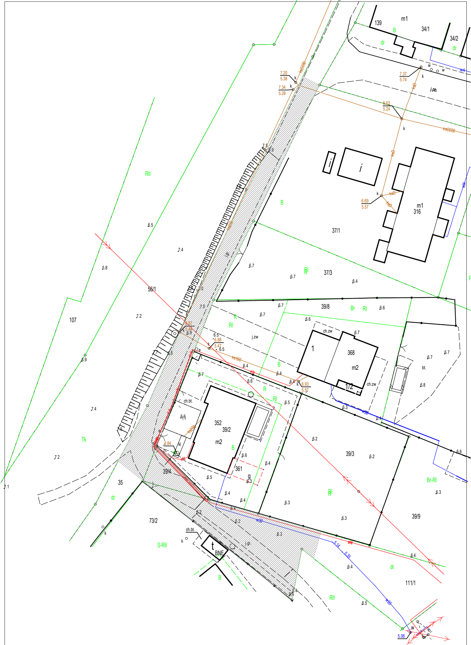
BUDOWA DROGI GMINNEJ WEWNĘTRZNEJ W LISEWIE MALBORSKIM W GMINIE LICHNOWY - PRZEWIDYWANY ZAKRES OPRACOWANIA