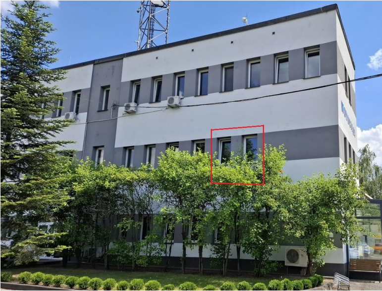
a) Ściana zewnętrzna budynku: