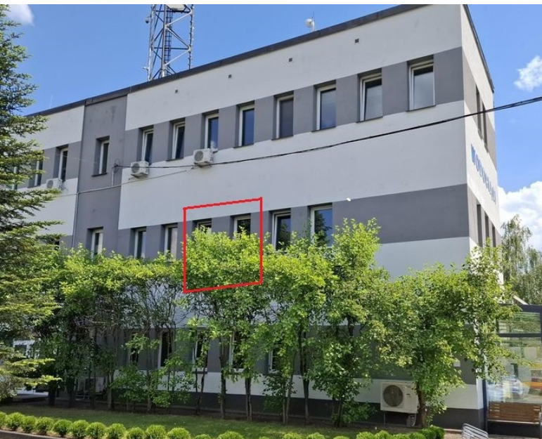
a) Ściana zewnętrzna budynku: