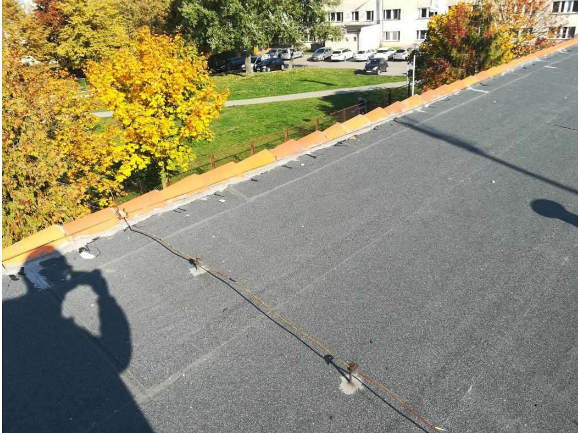
Fot.4 Widok dachu – gąsiory kalenicowe, instalacja odgromowa.