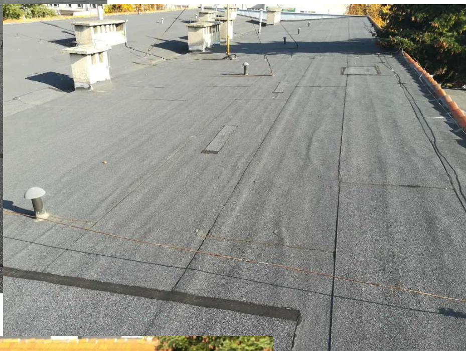
Fot. 2 Widok dachu