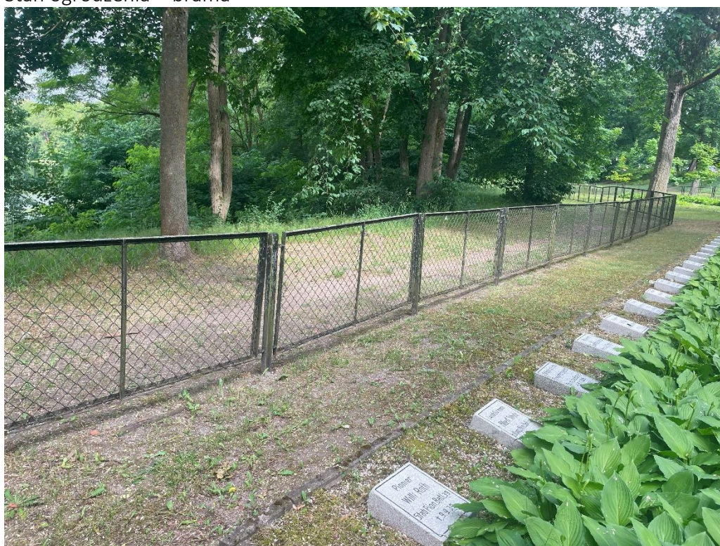
Stan ogrodzenia cmentarza garnizonowego od strony jeziora Popówka Mała