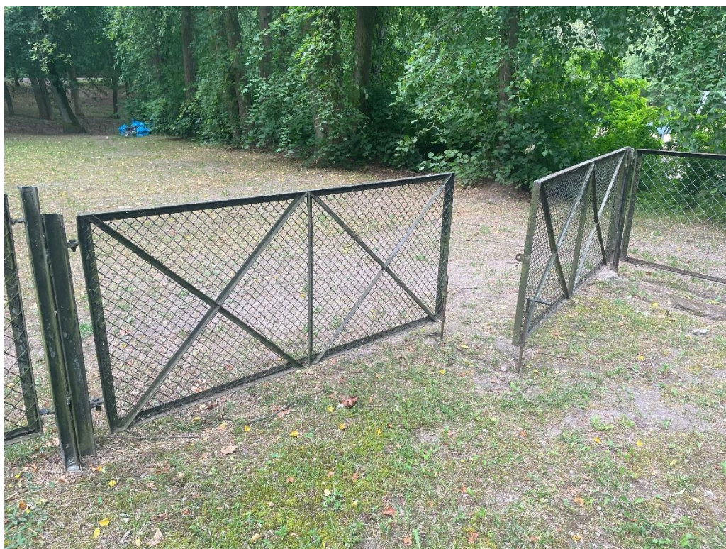
Stan ogrodzenia – brama