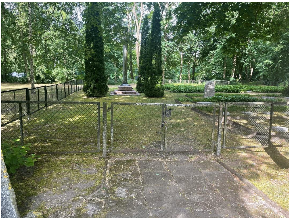
Stan ogrodzenia – furtka