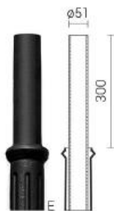
Typ zakończenia „E” – Ø60