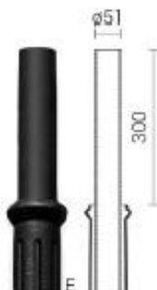
Typ zakończenia „E” – Ø60