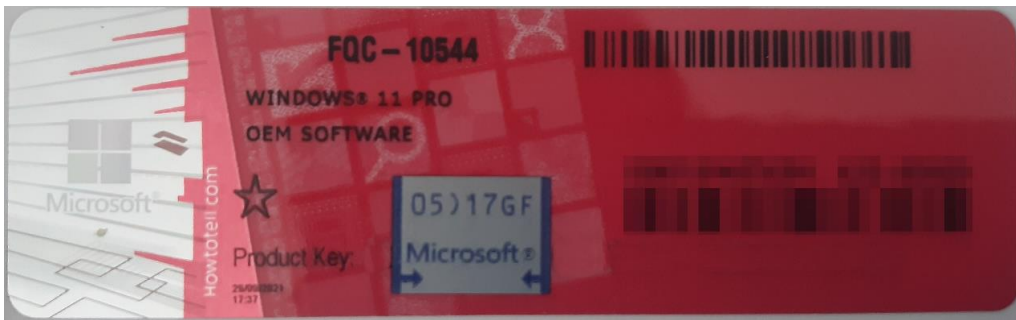
Rys. 1 przykładowy kod zabezpieczony przez producenta systemu Microsoft Windows 11 (takie same naklejki mają Windows 10) z wymazanym, znajdującym się przed i za szarą naklejką kodem licencyjnym