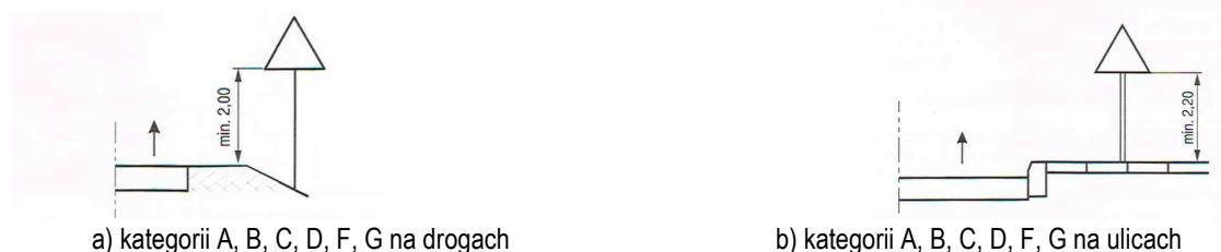
Rys. 2.2.3.2. Wysokość umieszczenia znaków:

a) kategorii A, B, C, D, F, G na drogach