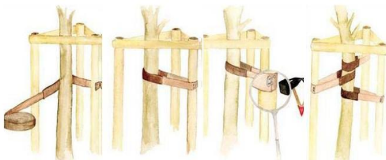
Ryc 2. Schemat prawidłowego wiązania pasów do palików