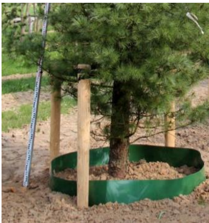
Ryc.3 Prawidłowe wiązanie drzewa iglastego