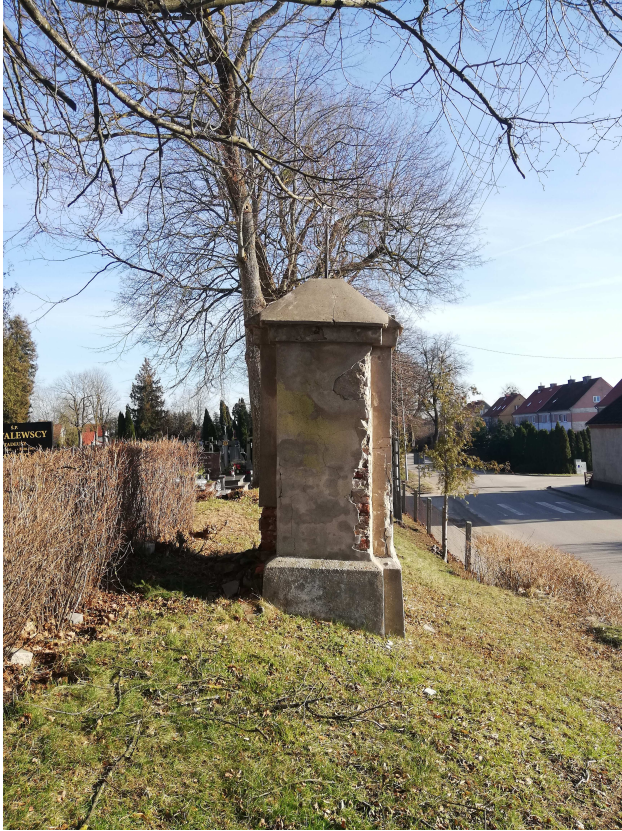
Kapliczka św. Jana Nepomucena