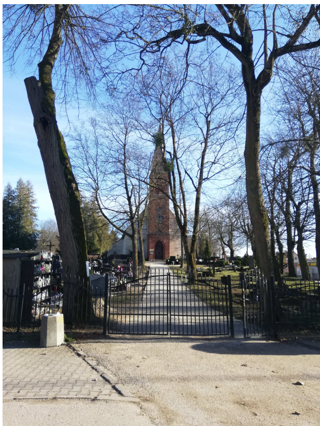
Widok od strony głównej bramy wjazdowej