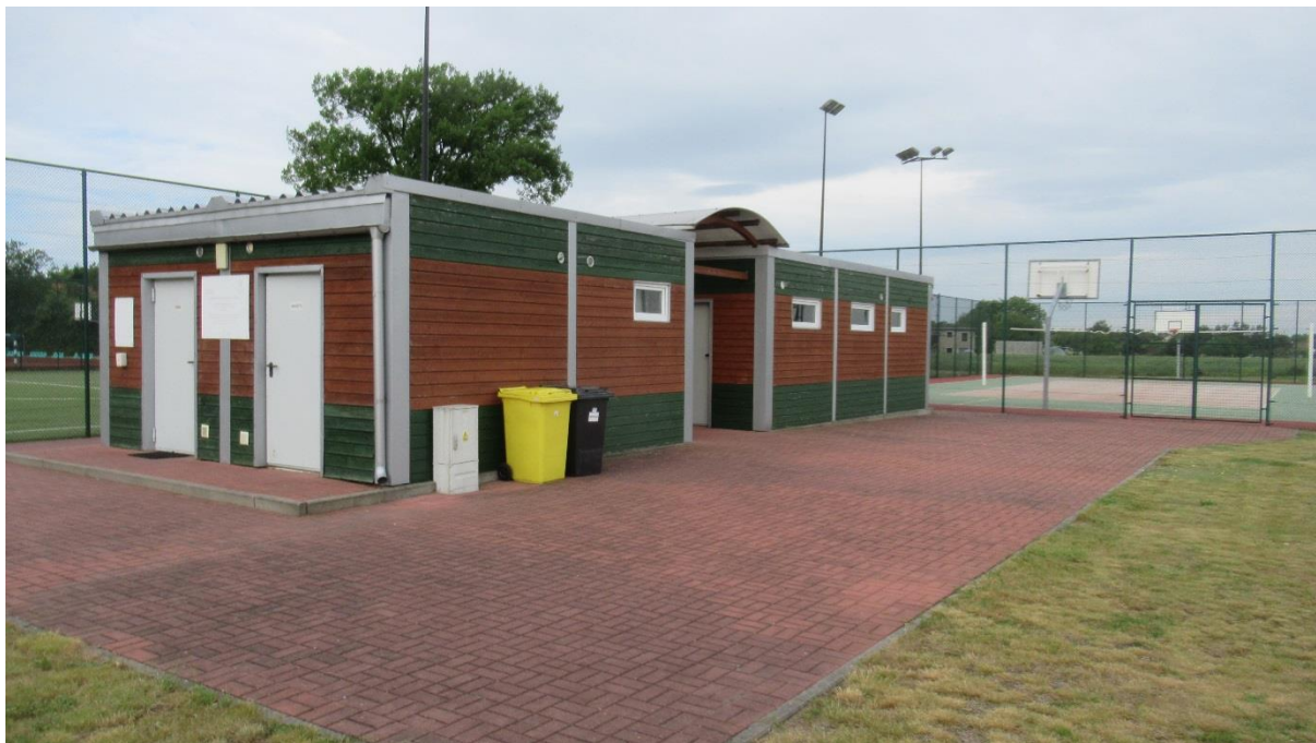
BUDYNEK ZAPLECZA SOCJALNEGO