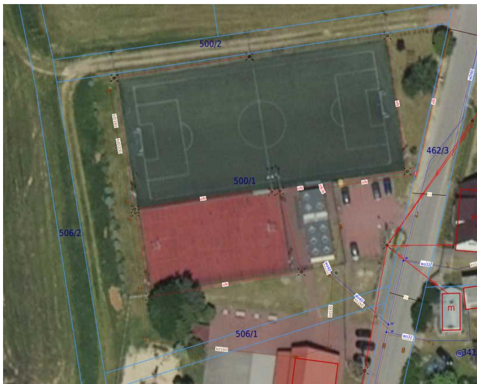
Kompleks sportowy na działce nr 500/1 w m. Lińsk.