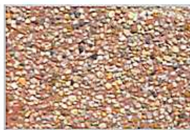
Kamień rzeczny barwiony na czerwono