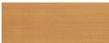
Dąb Jasny 2605