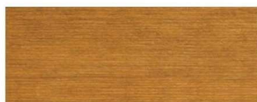
Dąb Rustykalny 2607