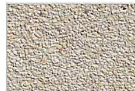
Grys biały na białym cemencie +10%