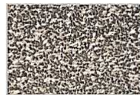
Grys czarno - biały 2