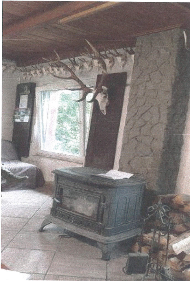
Fot. 1, 2 Pomieszczenie kancelarii leśnicówki. Widoczny jest piecyk – koza do demontażu oraz okna, gdzie zostanie zamontowany parapet podokienny drewniany.