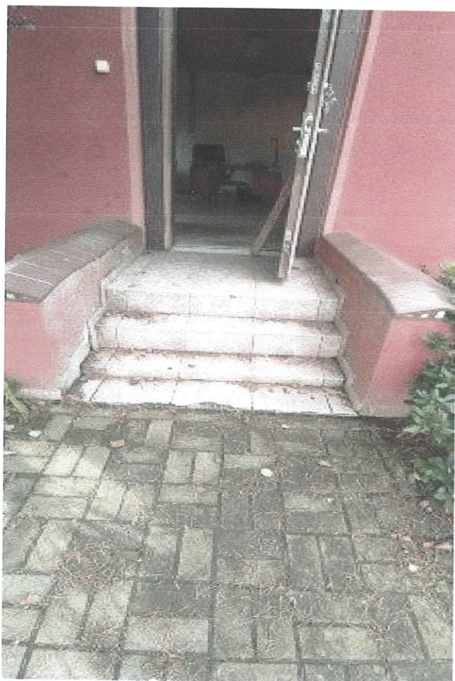
Fot. 4 Schody wejściowe do wyburzenia i wykonanie nowych schodów betonowych zgodnych z warunkami technicznymi