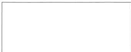
Pieczęć firmowa Wykonawcy