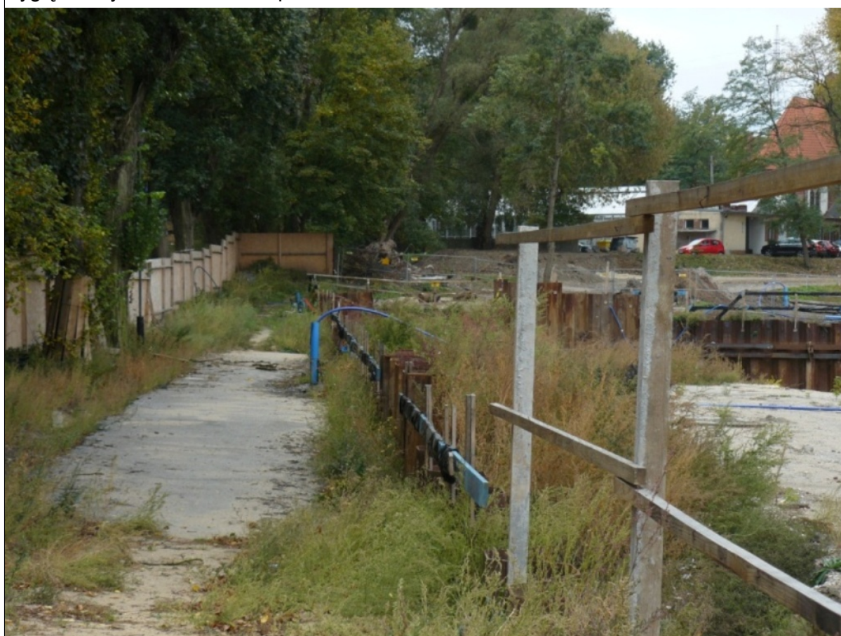
grodzie stalowe we wkopie