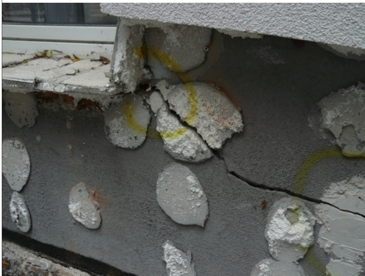
uszkodzenia budynku Babia Wieś 8