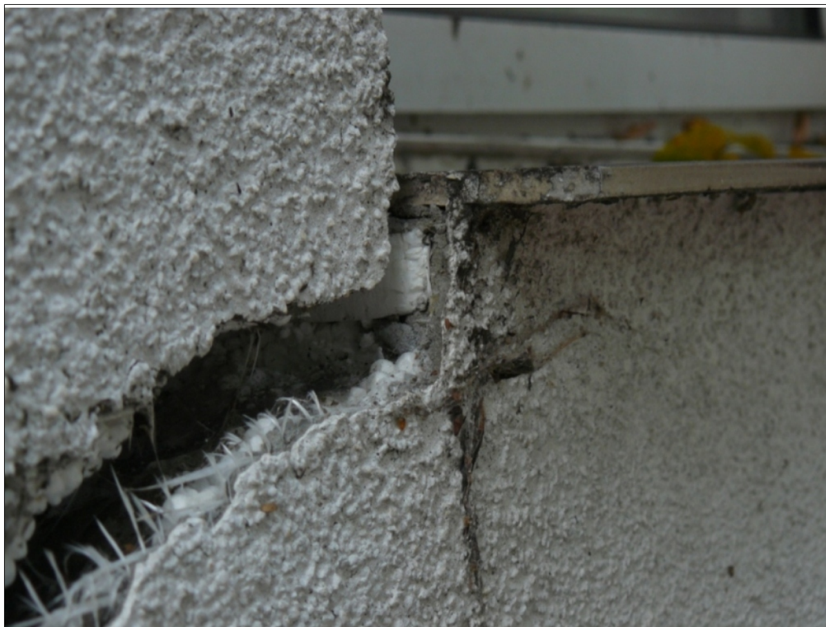
uszkodzenia budynku Babia Wieś 8