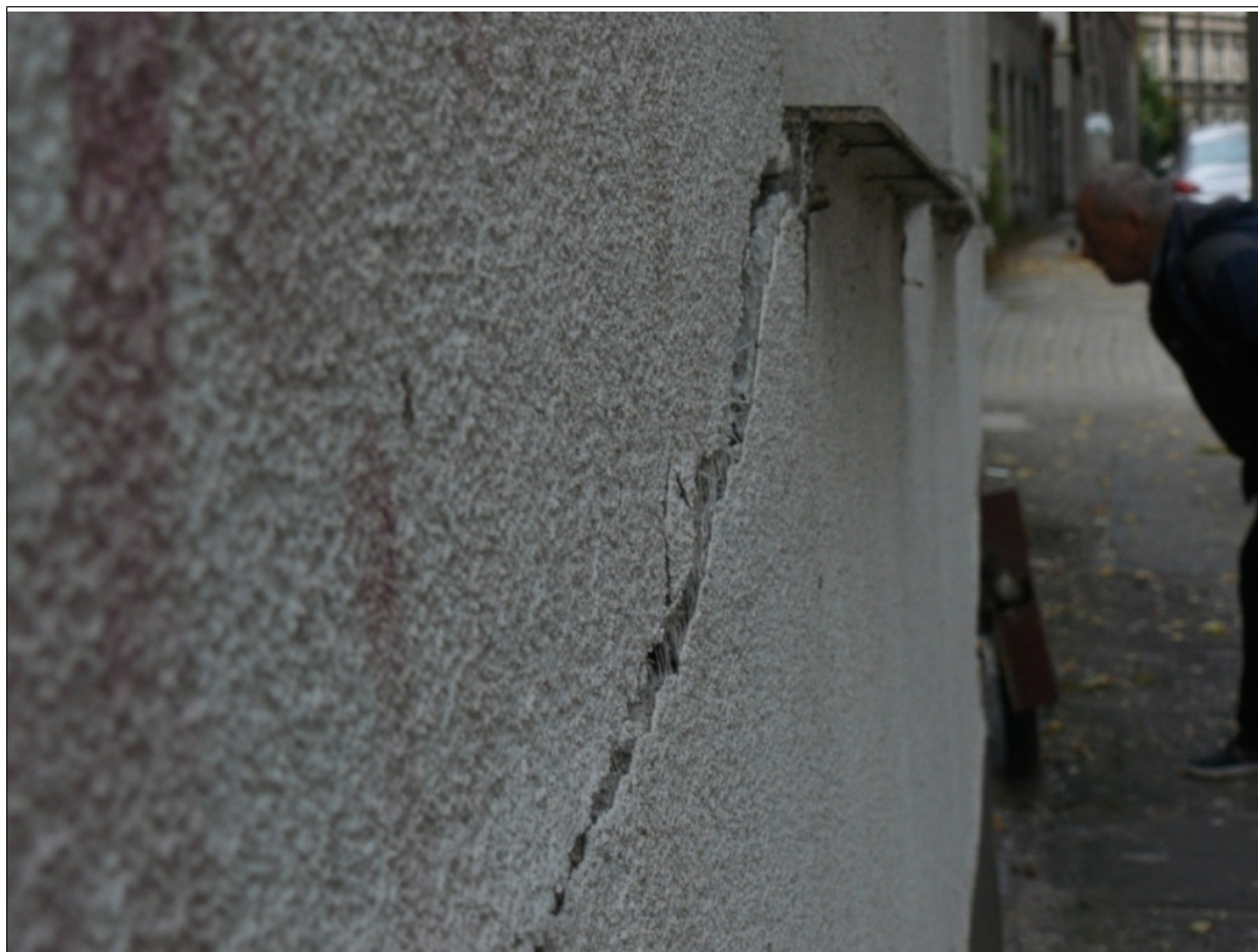
uszkodzenia budynku Babia Wieś 8