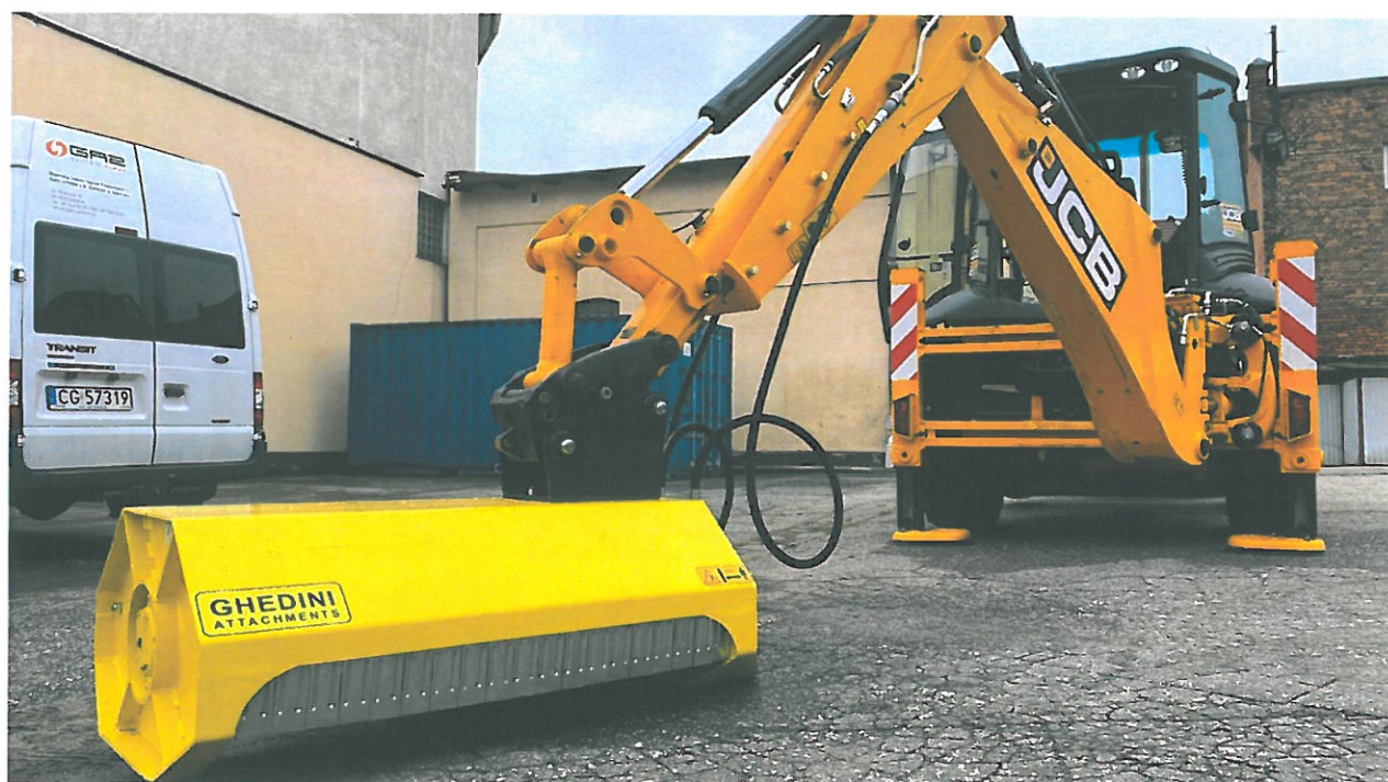
Zdjęcie nr 2 (przykładowa)