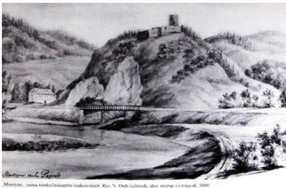
Muszyna - ruiny zamku biskupów krakowskich. Rys. N. Ordy (ołówek, akw. na pap.) z roku ok. 1880.