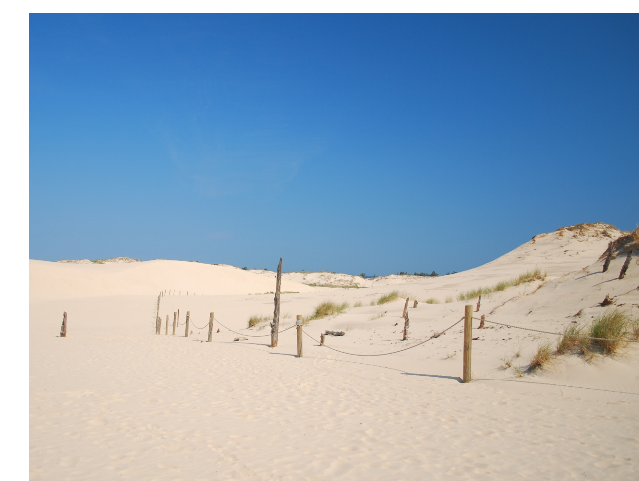
SŁOWIŃSKI PARK NARODOWY THE SŁOWIŃSKI NATIONAL PARK