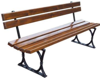
032.PK.PB.MA2 - Ławka warszawska

Wykonawca wnosi o jednoznaczne wskazanie, jakie ławki należy wykonać – te wg Projektu Budowlanego i wg Opisu przedmiotu zamówienia: