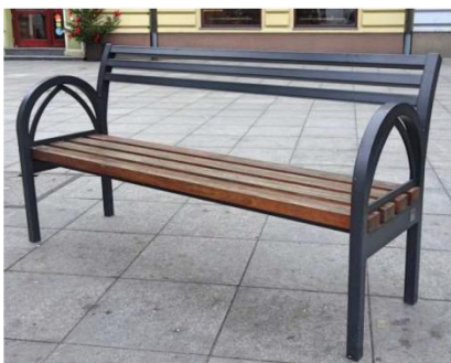
076.PK.PW.MA4 – Ławka

W przypadku braku wyjaśnień wykonawca założy rozwiązanie zgodne z PB i Opz.