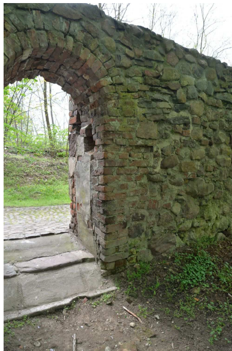
Fot. 7 Furta II, widok od zewnątrz, odcinek C

Na remontowanym odcinku muru wydzielono następujące elementy: