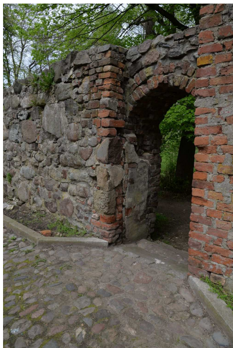
Fot. 6 Furta II, widok od wnętrza, odcinek C