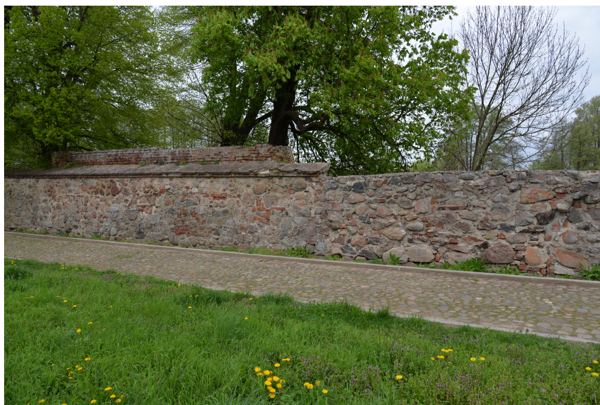
Fot. 2 Mury w Ośnie Lubuskim, widok od środka, koniec odcinka A, odcinek B