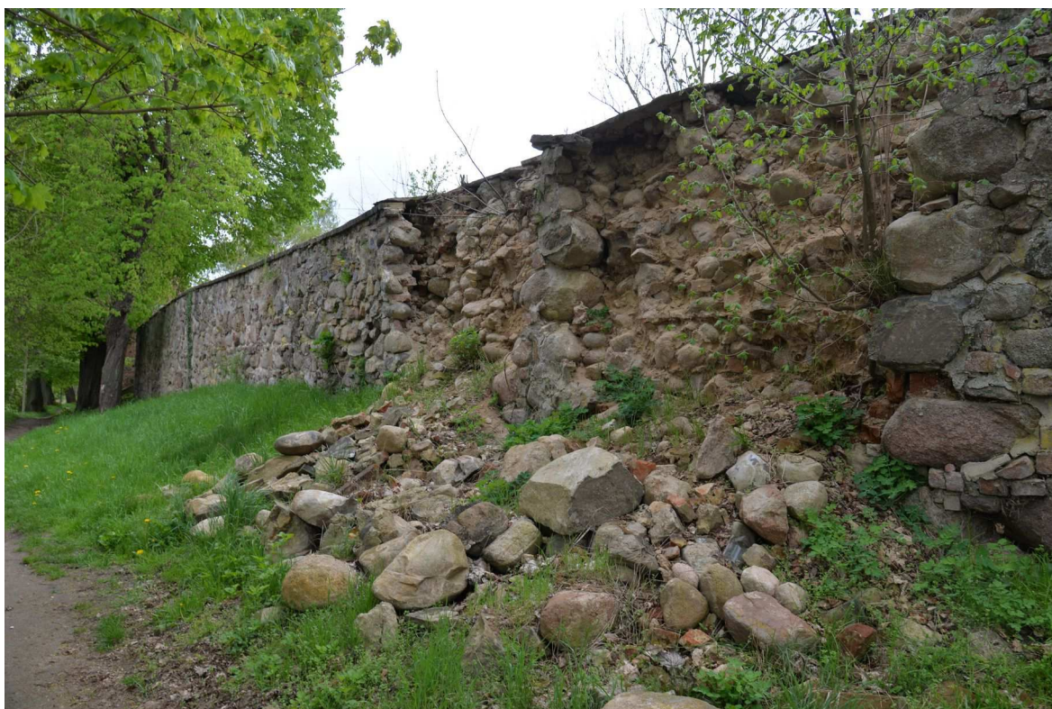
Fot. 4 Mury w Ośnie Lubuskim, widok od zewnątrz, zawalone lica muru, odcinek A