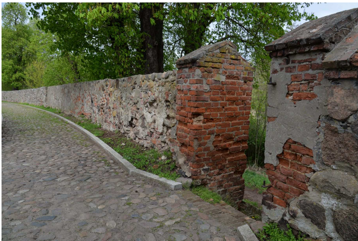
Fot. 3 Mury w Ośnie Lubuskim, widok od środka, mur pozbawiony lica odcinek A,