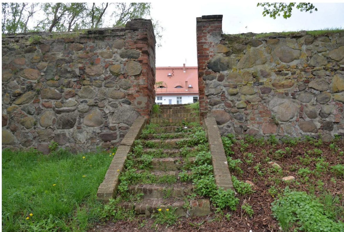
Fot. 1 Mury w Ośnie Lubuskim, widok od zewnątrz, furta I ze schodami, początek odcinka A,