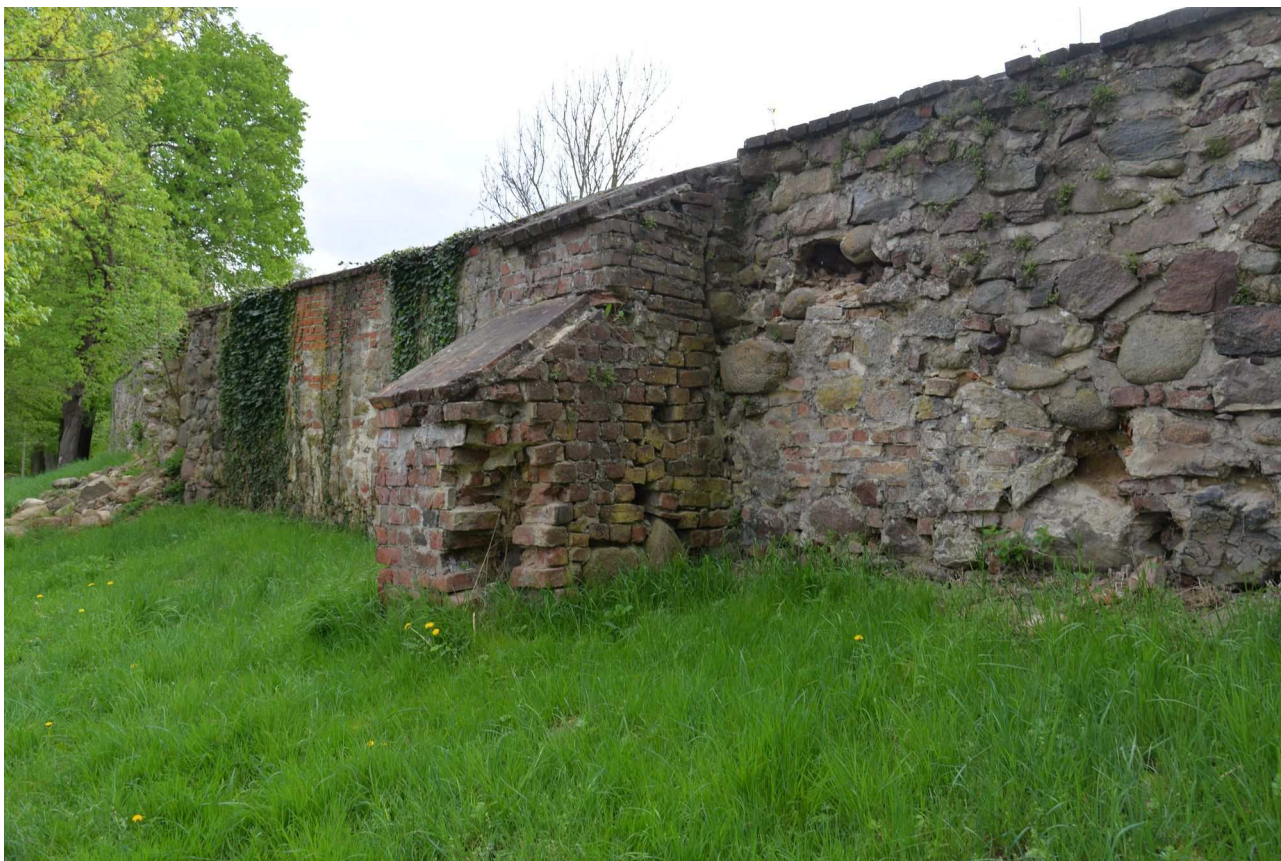
Fot. 5 Mury w Ośnie Lubuskim, widok od zewnątrz, uszkodzona przypora odcinek A