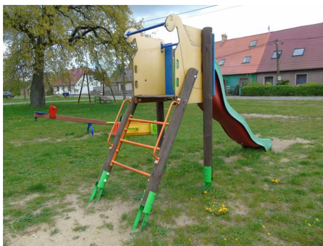
fot. nr 8.