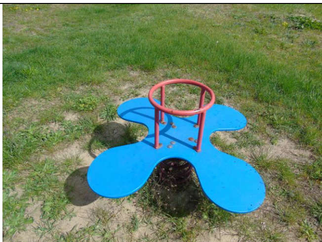
fot. nr 5.