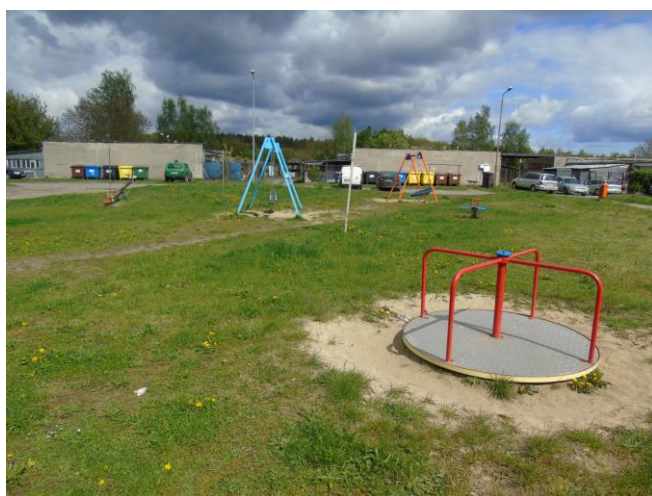
fot. nr 8.