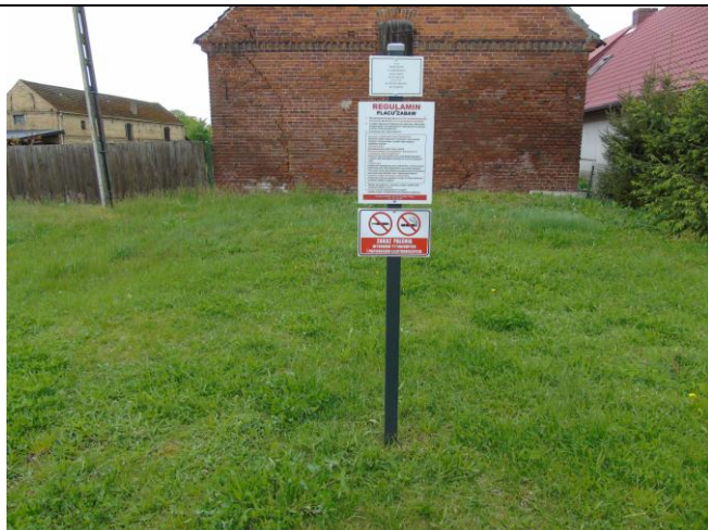
fot. nr 12.

Oświadczamy, iż ustalenia zawarte w protokole są zgodne ze stanem faktycznym. Dokonujący kontroli stanu technicznego: