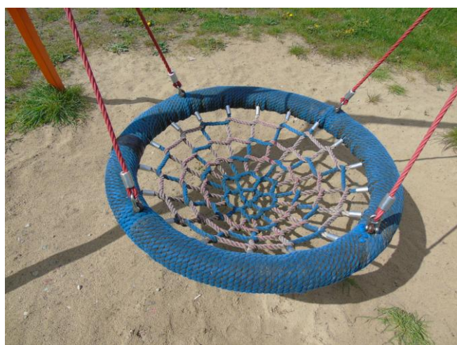
fot. nr 3.