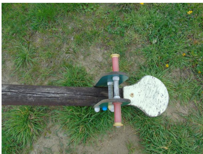
fot. nr 13.