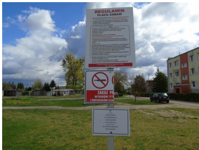
fot. nr 1.