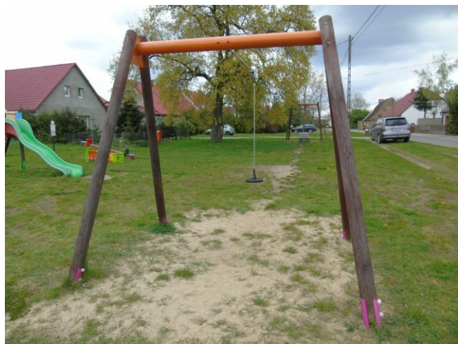
fot. nr 1.