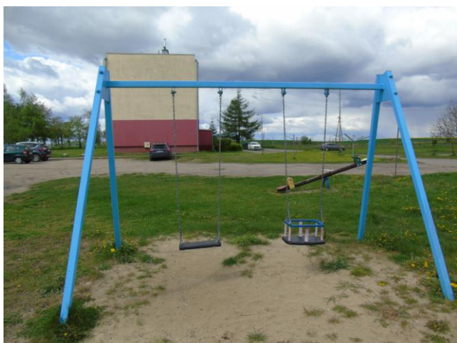
fot. nr 9.