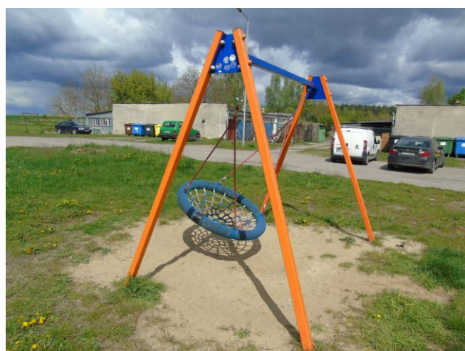
fot. nr 4.