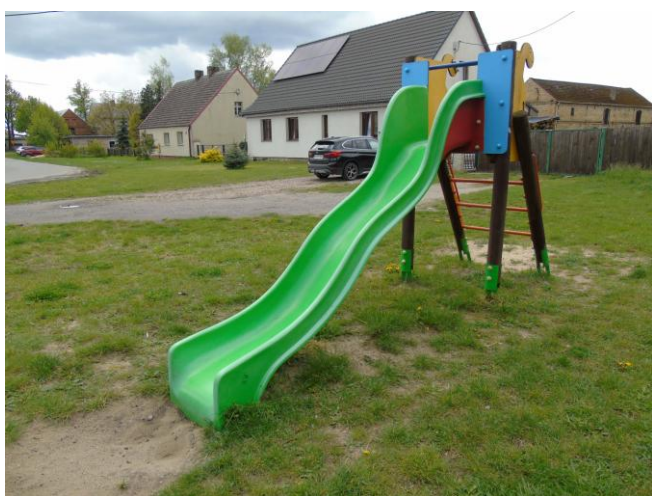
fot. nr 7.