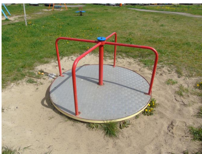
fot. nr 7.