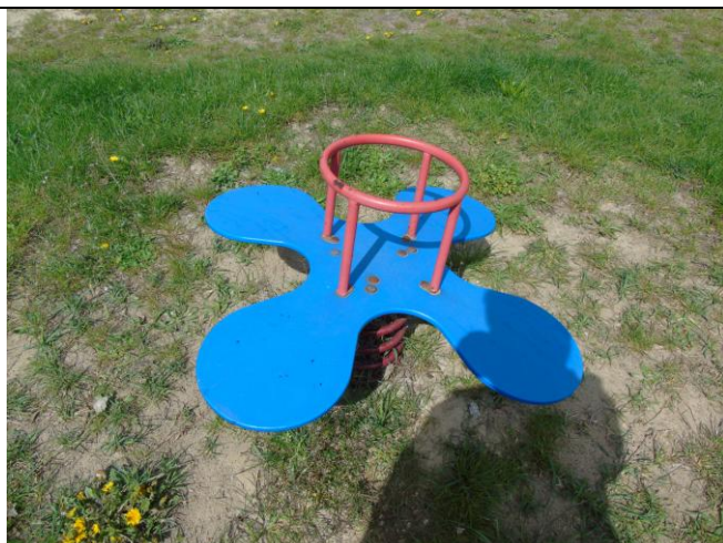
fot. nr 6.