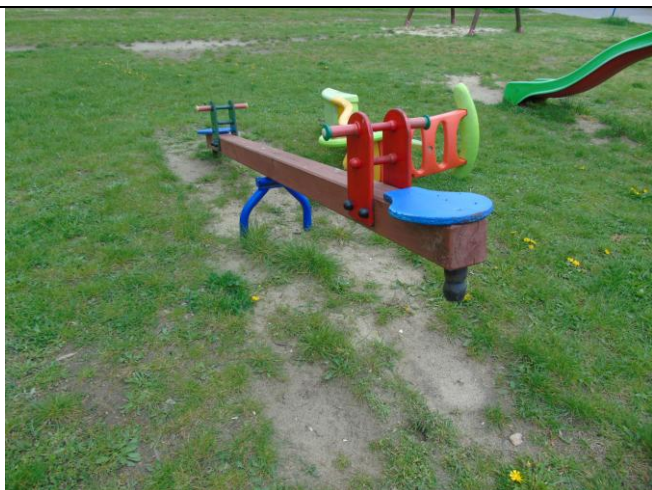
fot. nr 5.