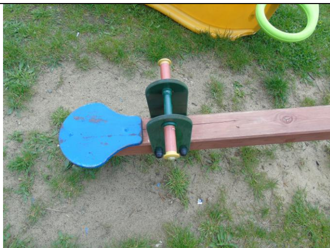
fot. nr 6.