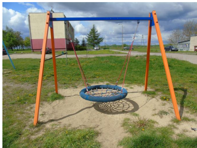
fot. nr 2.