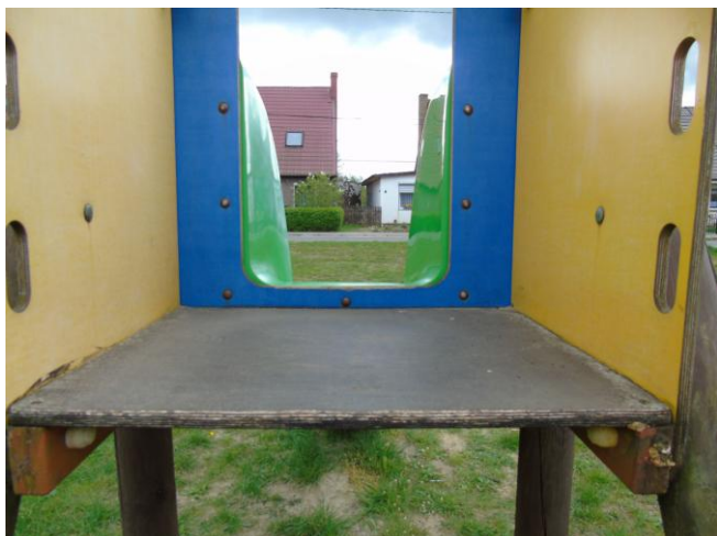
fot. nr 9.