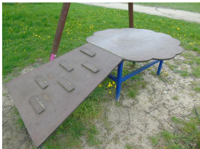
fot. nr 3.