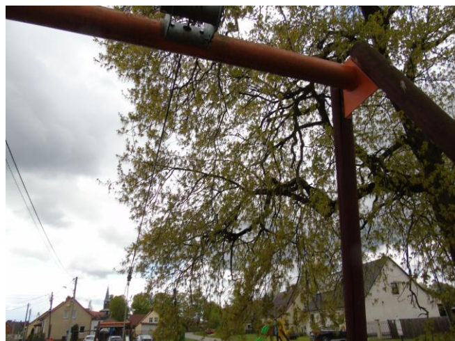
fot. nr 4.