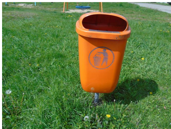
fot. nr 14.

Oświadczamy, iż ustalenia zawarte w protokole są zgodne ze stanem faktycznym. Dokonujący kontroli stanu technicznego: