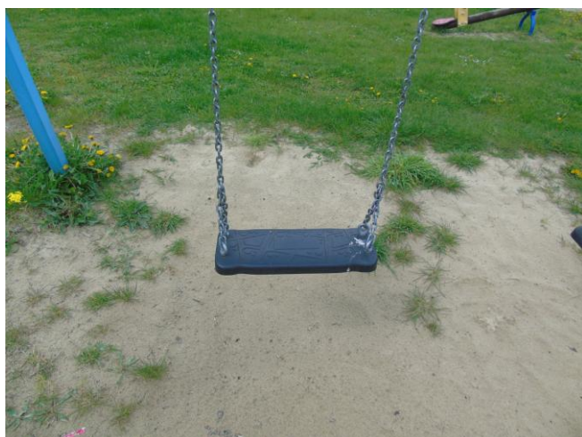
fot. nr 10.