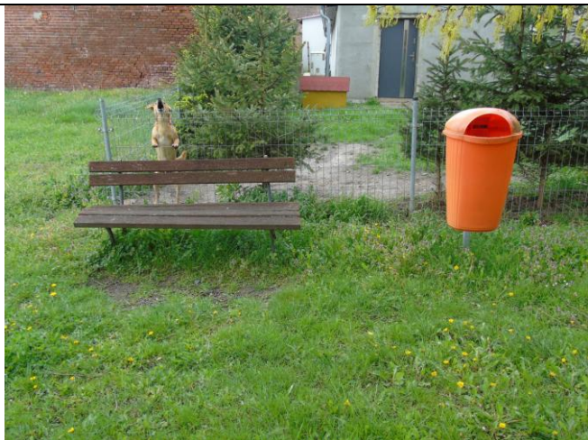
fot. nr 11.