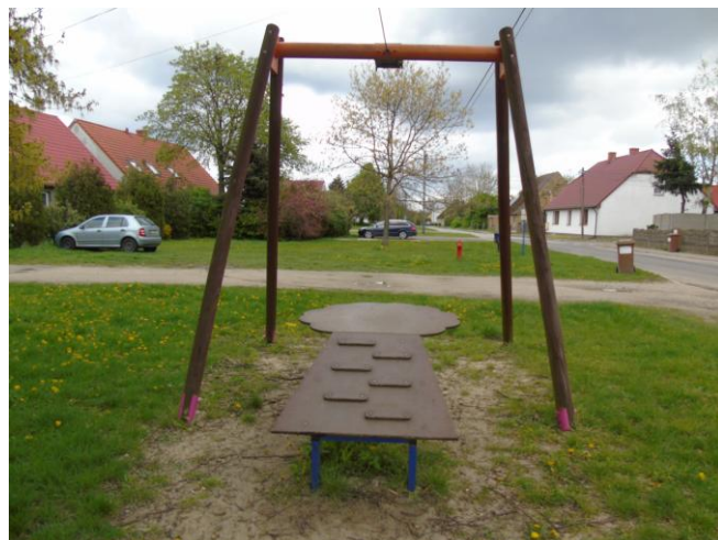
fot. nr 2.