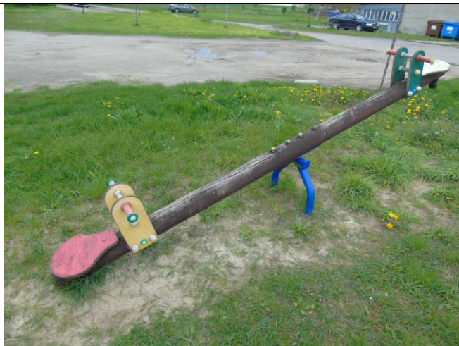
fot. nr 11.