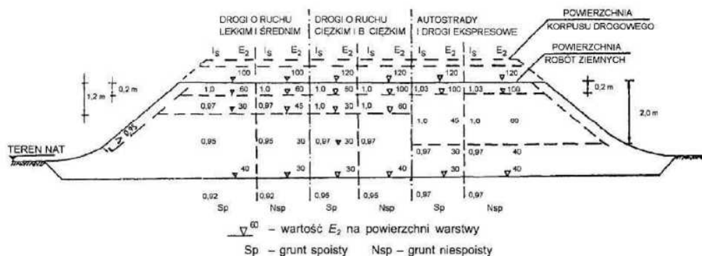
Rysunek 3 – Wartości wymagane w nasypach: wskaźnika zagęszczenia I_s i wtórnego modułu odkształcenia E_2 , megapaskali

Dodatkowo można sprawdzić nośność warstwy gruntu podłoża nasypu na podstawie pomiaru wtórnego modułu odkształcenia E_2 zgodnie z PN-02205:1998 [4] rysunek 3.