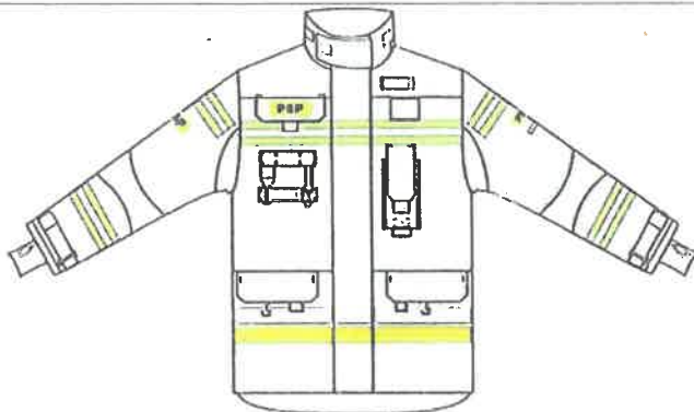
Przykładowy widok kurtki