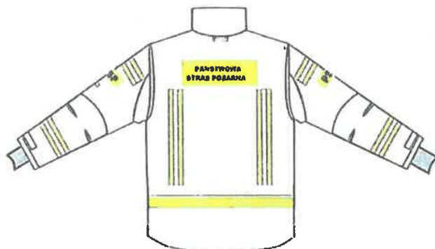
Przykładowy widok kurtki