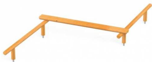
Równoważnia typu „zygzak”