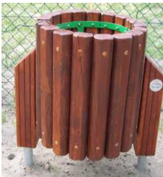
Kosz na śmieci