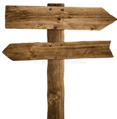
Tablica informacyjna kierunkowa na słupie drewnianym