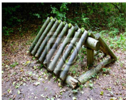
Stojak na rowery