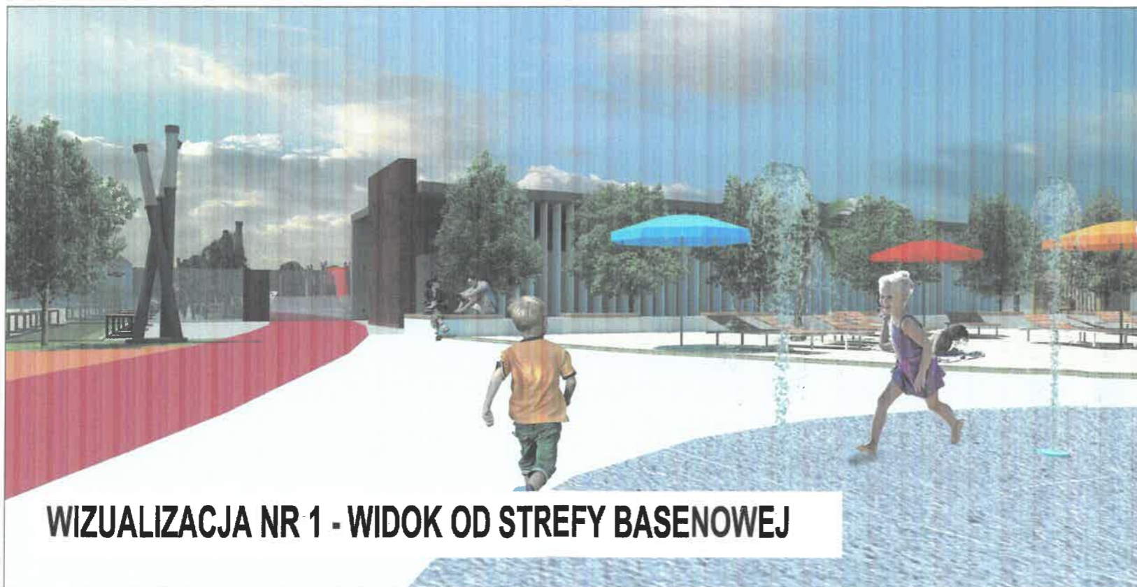
WIZUALIZACJA NR 1 - WIDOK OD STREFY BASENOWEJ