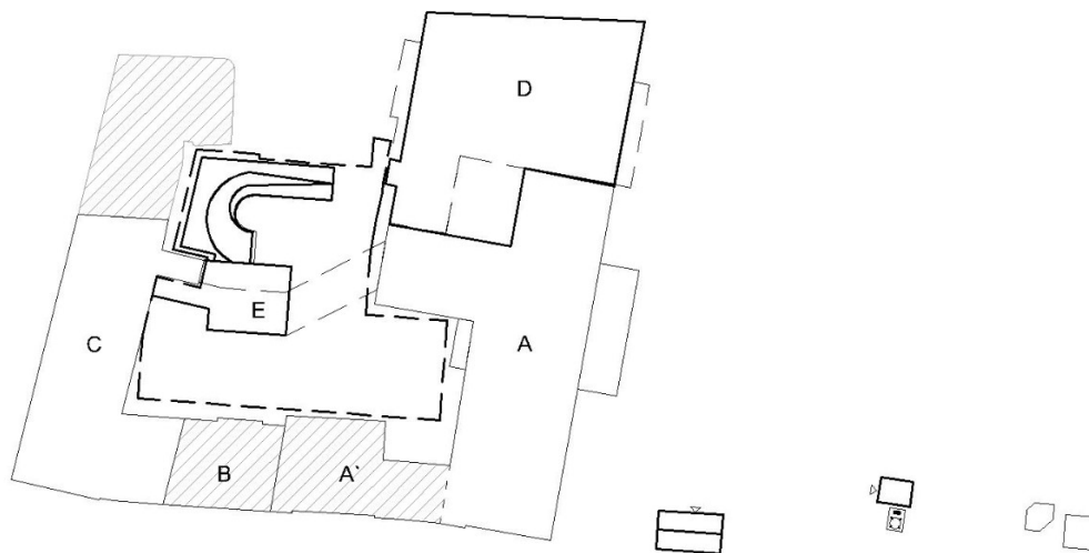
Schemat nazewnictwa budynków

Zasadniczą część inwestycji stanowi budynek „D”, „E” oraz „A” SCU św. Anny o łącznej powierzchni nowej zabudowy 1450,66m 2 , (budynek „A” - pozostaje bez zmian powierzchnia zabudowy), powierzchni netto 14 087,60m 2 , 5 kondygnacjach (1 podziemnej, 4 nadziemnych). Szpital z podziałem na oddziały o sumarycznej ilości łóżek szpitalnych 198. Budynekowi szpitala towarzyszy kompleksowe zagospodarowanie działki w postaci m.in.: parkingu podziemnego na 58 miejsc parkingowych, nowej stacji transformatorowej oraz nowego budynku tlenowni i uzbrojenia terenu.